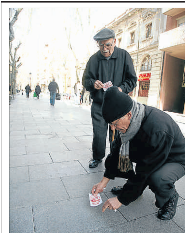
Sánchez i un amic marquen rajoles fluixes al Poblenou