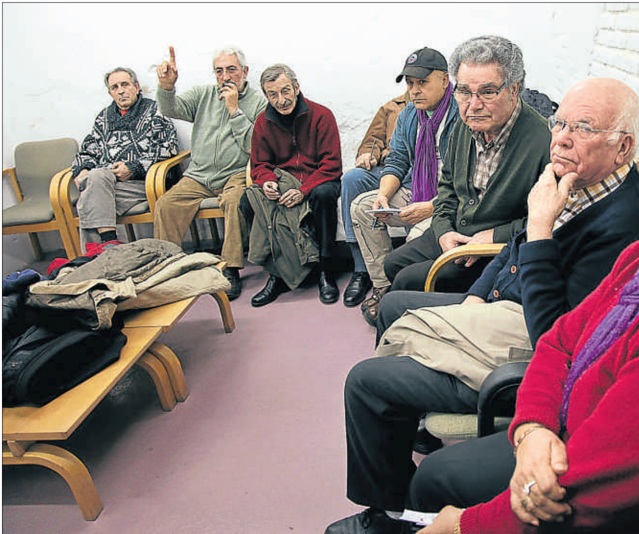
Assemblea a l’Ateneu. Un instant d’una de les assemblees dels iaioflautes i d’altres col·lectius de gent gran a l’Ateneu Roig del barri de Gràcia

Un cas revelador és el dels no-nagenaris escriptors José Luis