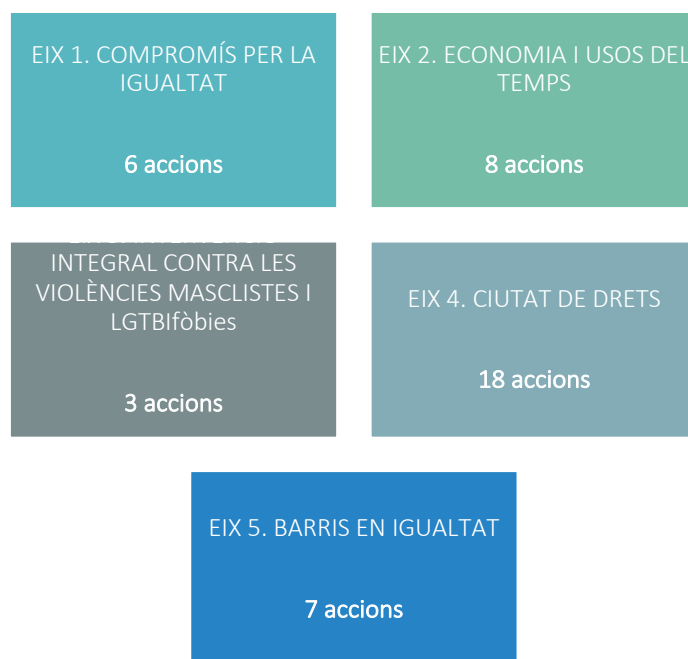
GRÀFICA 3. ÀMBITS O EIXOS ESTRATÈGICS DE TREBALL PREVISTOS EN EL PLA DE FEMINISMES I INTERSECCIONALITAT