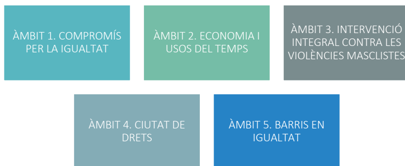
GRÀFICA 1. ÀMBITS O EIXOS ESTRATÈGICS DE TREBALL PREVISTOS EN EL PLA DE FEMINISMES I INTERSECCIONALITAT

Una primera part de Diagnosi que ens ha permès conèixer l'estat de la qüestió de les polítiques municipals d'igualtat de gènere i LGTBI a la ciutat de Tarragona en relació als diferents eixos plantejats.