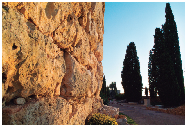
Muralla.