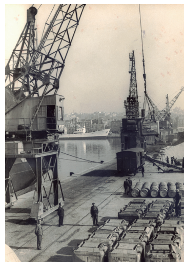
Port i comerç. Autor desconegut. Fons Boada

Visita per l'antic barri de la Marina, nucli del comerç marítim establert a partir de l'any 1790. S'hi aplegaven indústries, magatzems i tallers on els oficis i els productes a exportar centaven l'activitat portuària i comercial de la ciutat de Tarragona. Mercè Toldrà és llicenciada en Història i responsable del Museu del Port de Tarragona.