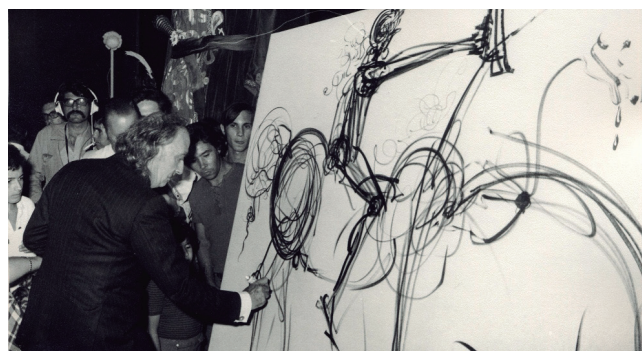
Dalí.