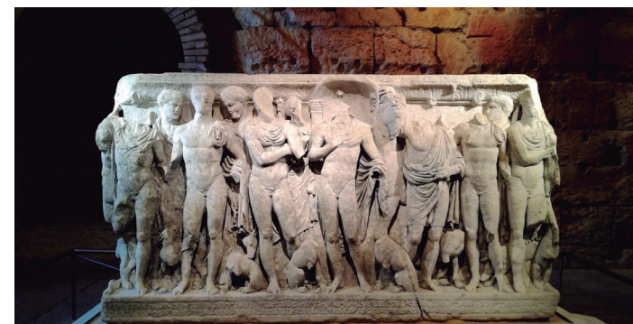
Sarcòfag d'Hipòlit.