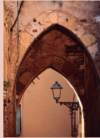
Tarragona medieval.

16 de setembre de 2018, a les 11 h. «Un passeig per la Tarragona medieval: espais de poder i de conflicte», a càrrec de les historiadores Esther Lozano i Marta Serrano.