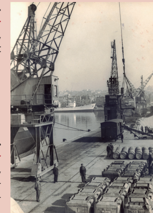
Port i comerç.