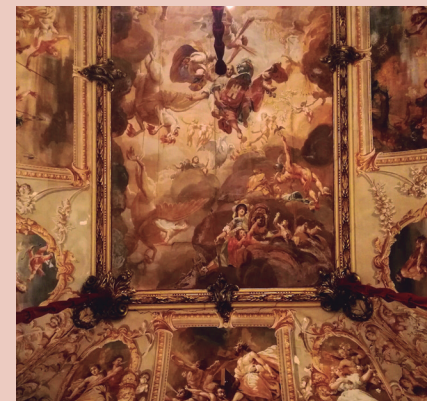
Pintures de Castellarnau.

17 de març de 2019, a les 11 h. «Sota les flames. Visita a les pintures de la Casa Castellarnau», a càrrec de Maite Blay, professora de llatí i cultura clàssica a l'Institut Pons d'Icart.