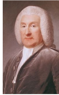
Antoine de Sartine