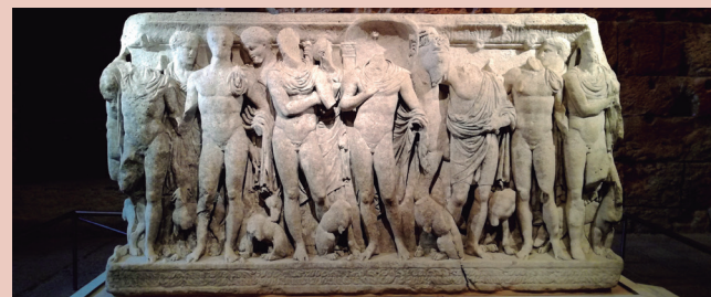
Sarcòfag d'Hipòlit.

9 de desembre de 2018, a les 11 h. «Redescobrir el sarcòfag d'Hipòlit», a càrrec de Jordi Abelló, tècnic del Museu d'Història de Tarragona.