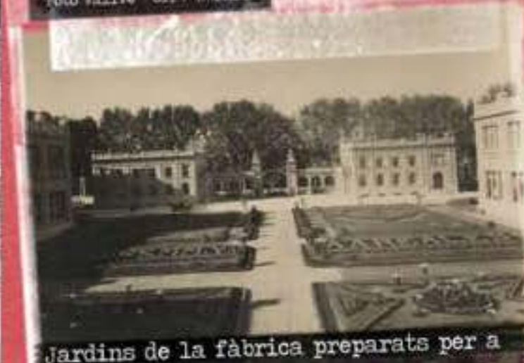
Jardins de la fàbrica preparats per a rebre la visita del rei Alfons XIII el 28 d'octubre de 1927