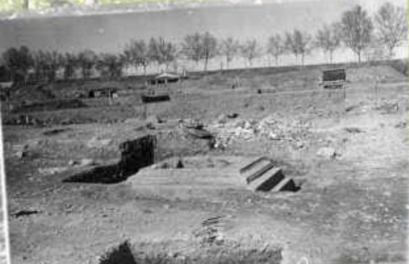
Inici de les excavacions de la necròpolis paleocristiana que comportà desplaçar l'emplaçament previst de la fàbrica (1924)