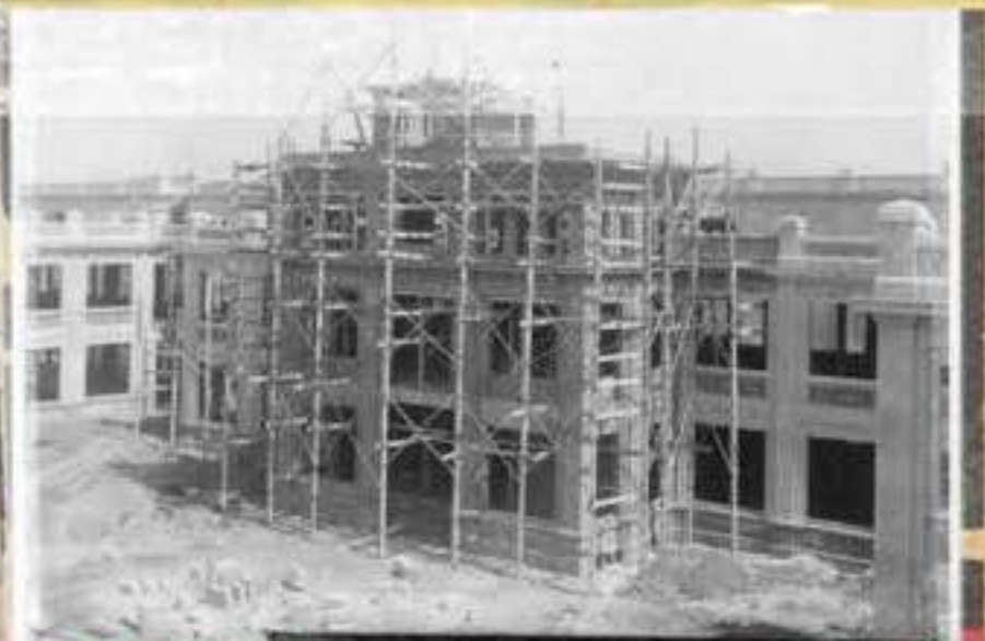
Bastides en la construcció de la façana de l'edifici central (1927)