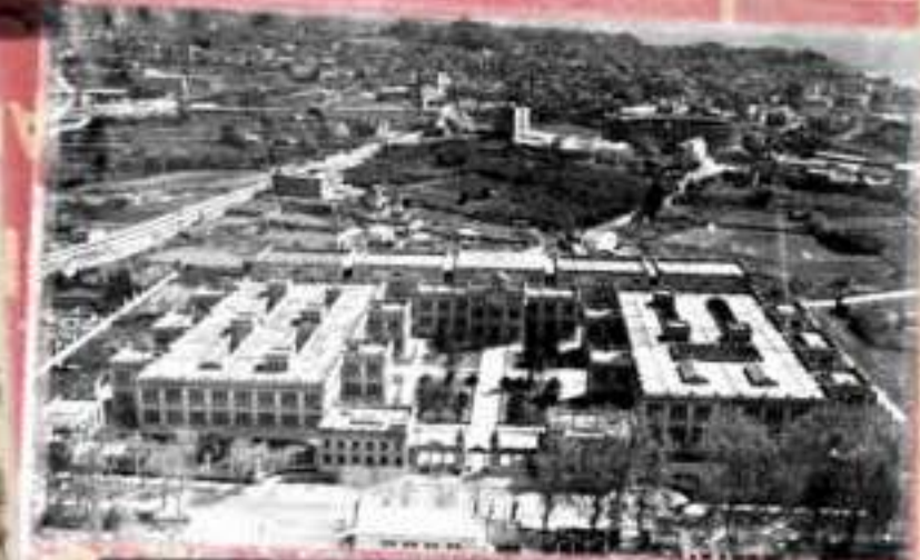
Vista aèria del complex de la Fàbrica de Tabaca, que no es va considerar acabada fins a l'any 1931 (1929)