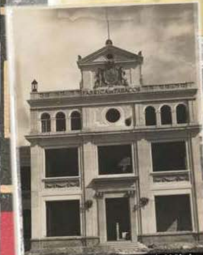
Façana en construcció de l'edifici central de la fàbrica principal (1927)