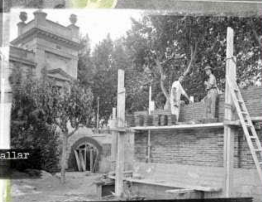
Obrers treballant en el mur exterior