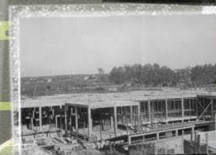
Treballs de construcció del sòtan i de la planta baixa dels edificis de la fàbrica (1925)