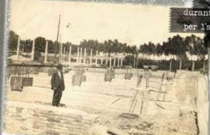
L'enginyer en cap, Josep Tulla Planella, dirigint la construcció dels fonaments de la fàbrica (1925)