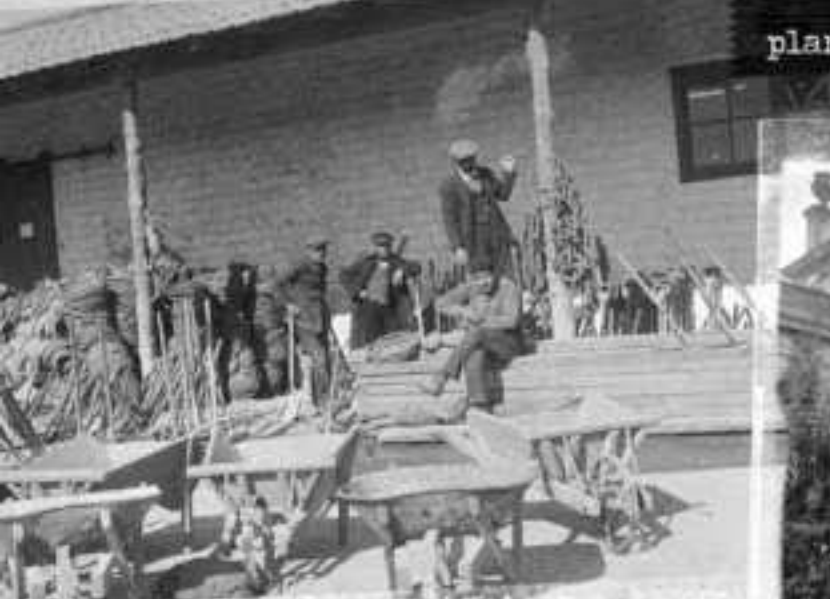
Una mitjana d'un miler d'obrers van treballar entre 1923 i 1927 en la construcció dels edificis (1926)