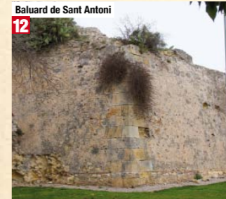
Baluard de Sant Antoni 12