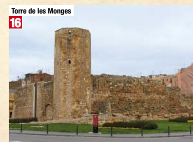
Torre de les Monges 16