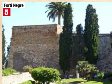
Forti Negre 5