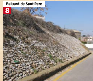
Baluard de Sant Pere 8