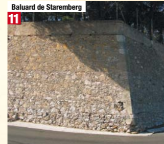
Baluard de Staremberg 11