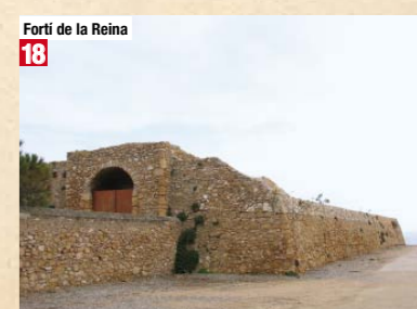
Forti de la Reina 18

Mémories du Maréchal Suchet, Duc d'Albufera, sur ses campagnes en Espagne depuis 1808 jusqu'en 1814 : écrits par lui-même. Louis Gabriel Suchet. Paris, 1834.