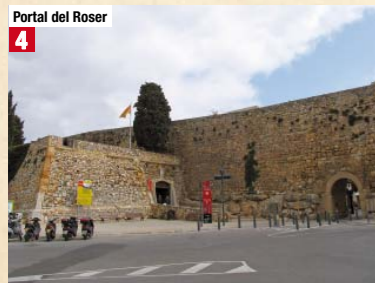
Portal del Roser 4