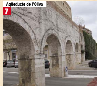
Aqüeducte de l'Oliva 7