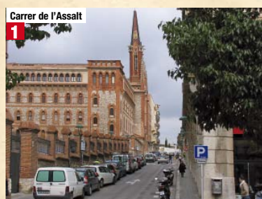
Carrer de l'Assalt 1