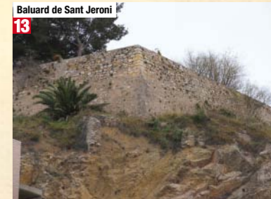
Baluard de Sant Jeroni 13