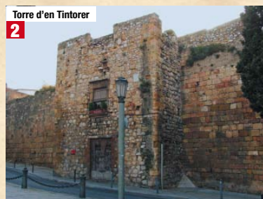
Torre d'en Tintorer 2