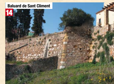
Baluard de Sant Climent 14