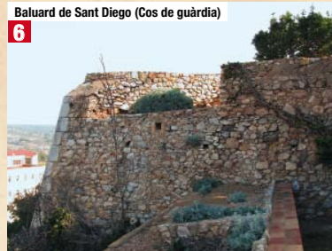
Baluard de Sant Diego (Cos de guàrdia) 6