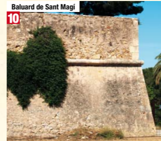
Baluard de Sant Magi 10