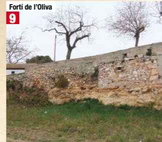
Forti de l'Oliva 9