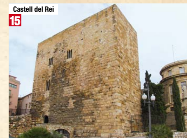
Castell del Rei 15