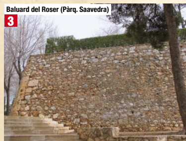
Baluard del Roser (Pàrq. Saavedra) 3