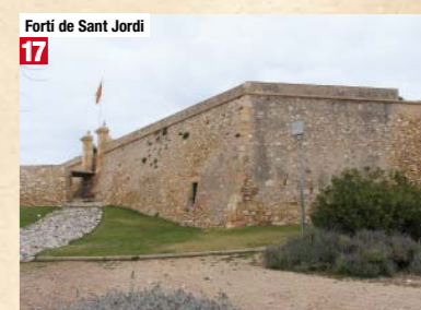
Forti de Sant Jordi 17