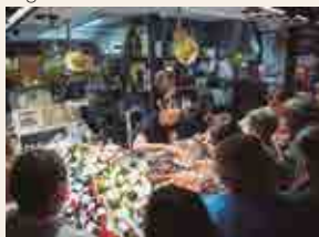
Mercat de Nit

Organitza: Associació de Concessionaris del Mercat Central de Tarragona