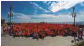
Festa per a tothom

Col·laboren: Llegat 2018 AVCT - Penya Festa per a Tothom, Col·legi d'Educaadores i Educadors Socials de Catalunya (CEESC), Autocars NIKA, ONCE, AFA - Associació d'Alzheimer de Tarragona, Associació Provincial de Paràlisi Cerebral de la Província de Tarragona, ASPERCAMP, Circ Social de Reus, STS Assistencial, Raffa Gelati i Xiquets de Tarragona