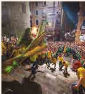
La Baixada de l'Àliga

24 h, des del pla de la Seu. Vinga, valents! La Baixada de l'Àliga, els Gegants Vells, el Lleó, la Mulassa i les bandes. Bèsties i gegants són portats aquesta nit per tots els qui, amb el consell i l'assistència dels seus portadors titulars, ho desitgin. Quan les bèsties i els gegants entren a la plaça del Rei, l'orquestra Versión Privada els obsequiarà amb la tanda d' Amparitos que marca el costum.