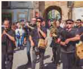
L'entrada de Músics

A l'acabar, pl. de les Cols. Santa Tecla gastronòmica. El concert de Vermut Yzaguirre i les patates Frit Ravich amb la Fanfara de Torredembarra . Degustació de vermut i patates.