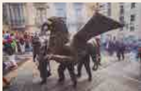
Griu de Tarragona © Laia Díaz

18.30 h , Som Espai Nautilus, c. Reiding, 9. Inauguració de l'exposició "L'evolució gràfica dels programes de Santa Tecla 1900-2019" . Aquest nou espai cultural de la ciutat ens mostra a través de la col·lecció del Sr. Enric Benaiges un recorregut detallat pel patrimoni gràfic dels programes de la nostra festa major. Horari: del 14 al 25 de setembre, de 10 a 13 h i de 17 a 20 h.