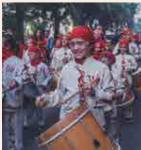
Correfoc Petit

Correfoc Petit. És l'hora que els més petits puguin gaudir del correfoc fet a la seva mida sota els paraigües d'espurnes dels diables i les bèsties a la seva alçada. Els grups recorreran la Rambla Nova fins a arribar a la plaça Corsini per fer-hi una carretillada de lluïment. Quan acabin d'entrar els grups a la plaça Corsini encendran una carretillada conjunta final. Hi participen el Ball de Diables Petit, el Drac Petit, el Bou Petit, la Vibrieta i el Griu Petit, i com a grups convidats, el Cabrot Petit del Vendrell, el Ball de Diables Petit de Constantí i el Ball de Diables Infantil de Torredembarra.