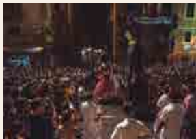
Tornada de Professó

Tot seguit, des del pla de la Seu. Tornada de Professó amb la Baixada del Seguici. Portants, balladors i músics enfilen el carrer Major en una baixada espectacular. El conjunt del Seguici completa la seva darrera aparició d'aquest 2019.