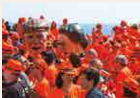
Festa per a Tothom

Col·laboren: ONCE, STS Assistencial i Raffa Gelati