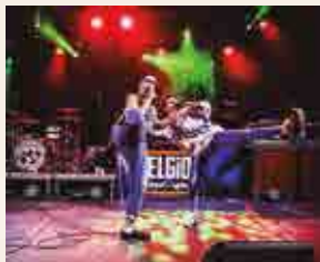
Las niñas perdidas

1.45 h , pg. de les Palmeres. Nou concert de Barraques amb Lil Russia. Rap des de la perifèria de Barcelona, amb ritmes hip-hop, trap i reggaeton, lletres fetes amb cura, des de l'empoderament de la dona i amb perspectiva de classe.