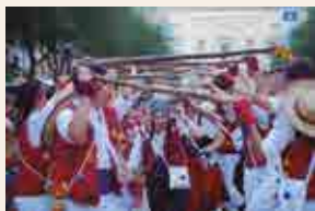
Cercavila de Santa Tecla

19 h , pg. de les Palmeres. Obertura de l'Espai Barraques.