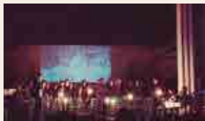
Cor Ciutat de Tarragona

21 h , jardins de Saavedra, La Terrasseta. Fira Food Trucks. Sopar a la fresca a preus populars. Ampliem l'oferta gastronòmica amb sis espais culinaris amb productes de la terra, ecològics i de proximitat. Preus populars.