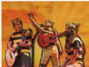
La Tresca i la Verdesca

12 h , pl. de la Rumba (antiga pl. de l'Antic Escorxador). 7è Vermut Rumber de Santa Tecla. Fidel a la