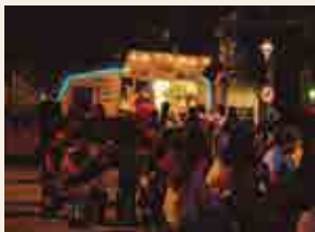
Fira Food Trucks

21.15 h , jardins de Saavedra, La Terrasetta. Cinema a la fresca. Cinema Paradiso (1988), de Giuseppe Tornatore.