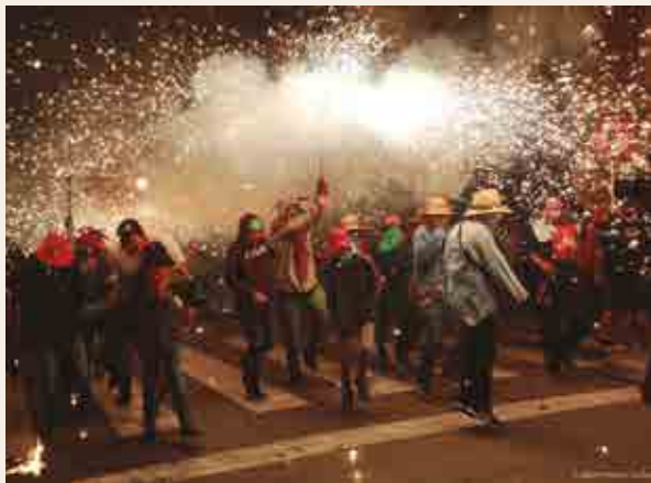
Correfoc de Santa Tecla.

any, l'última nit de festes s'omple de les espurnes i els trons de carretilles i sortidors. Enguany les forces de l'infern estaran representades pels grups Ball de Diables de Vilanova i la Geltrú, Ball de Diables de Sant Quintí de Mediona, Ball de Diables de Torredembarra, Ball de Diables de Tarragona, Colla Diables Voram del Serrallo, Drac del Morell, Drac de Bellvei, Drac de Tarragona, Bou de Tarragona, Víbria de Tarragona i Griu de Tarragona . Recorregut: pl. de la Mitja Lluna, c. Unió, pujada per la Rambla Nova fins al c. Adrià per un lateral, baixada per la Rambla Nova per l'altre lateral a l'altura del c. Sant Agustí, estàtua dels despullats, c. Cañellas i pl. Corsini.