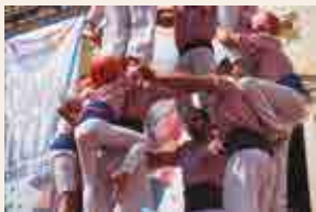
Xiquets de Tarragona © Laia Díaz