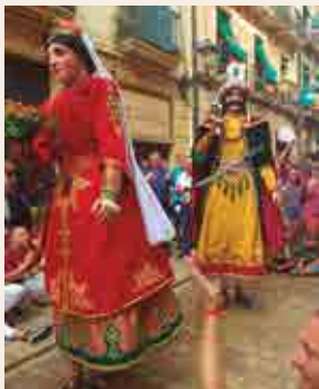
Gegants Vells Petits.