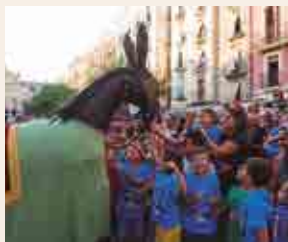
Cercavila de la Santa Tecla Petita

18.30 h , des de la pl. de la Font. Cercavila de la Santa Tecla Petita . El Seguici Petit enceta les aparicions dels elements més representatius de la nostra festa. Reproduint l'estètica i la manera de fer del Seguici gran, ompliran places i carrers de músiques, balls i espurnes. Enguany, i per commemorar el 5è aniversari del Griu, veurem per primer cop el Griu Petit, que serà apadrinat per la Virgília Petita de Torredembarra. També sortiran els Gegants Vells Petits, que participaran per primer cop en la cercavila de la Santa Tecla Petita.