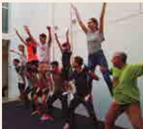
Nova Moixiganga de Reus

Col·laboren: Penya Festa per a Tothom - Llegat 2018, Dow, Aspercamp i Circ Social de Reus