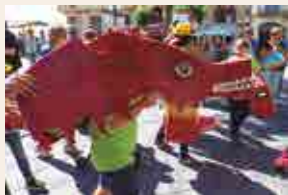
Fes-te la Festa

12 h , costa de Tarragona. XXXVIII Regata Santa Tecla de vela-creuers .