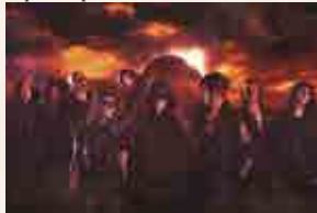
Magõ de Oz

22.30 h , Anella Mediterrània, Campclar. El macroconcert més tecler torna al bell mig dels nostres barris de Ponent amb Mägo de Oz i Debler . Mägo de Oz sempre s'ha mogut per incomptables terrenys musicals. Amb la música cel·ta i el heavy-metal sempre presents com a base, la banda madrilenya ha passat pel power-metal de la trilogia Gaia , el folk-rock suau de La ciudad de los árboles o els elements simfònics i alternatius d' Atlantia . Avui compartiran escenari amb els Debler, aquest quintet madrileny cada vegada més consolidat com una gran realitat del metal que es fa a l'Estat. Tot plegat, una nit de trepidant rock&roll de primer nivell. Concert gratuït. Serveis de transport públic especial per al concert.