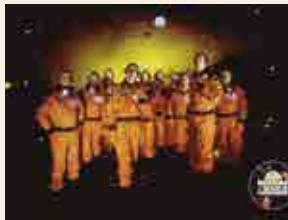
Reggae per xics

11 h, pl. de la Font. Festa del 10è aniversari del Club dels Tarraconins. Ja han passat 10 anys i avui toca celebrar aquest desè aniversari de la millor manera possible, que és trobant-nos per la festa major a la plaça de la Font tota la gran família del Club. Cantarem i ballarem amb els The Penguins i el seu espectacle Reggae per xics , no us ho podeu perdre! Serà un matí familiar ple de sorpreses. Tarraconins i tarraconines, a plaça!