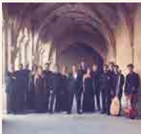
Ensemble O Vos Omnes