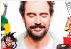
Les coses excepcionals

20.30 h , Sala Trono Armanyà, c. Armanyà, 11. Les coses excepcionals , de Duncan Macmillan. Tens set anys i la mare és a l'hospital. El pare diu que ha fet "alguna cosa estúpida". Li costa ser feliç. Així que comences a fer una llista de les coses excepcionals d'aquest món. Cadascuna de les coses que fan que la vida valgui la pena. Teatre. 70 min. Català. Venda d'entrades: www.salatrono.com .