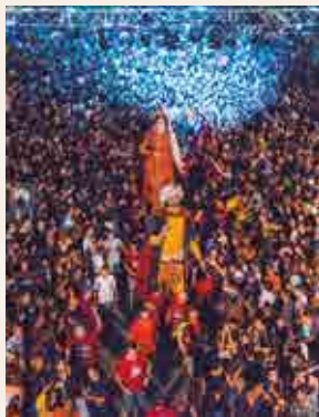
Ball de l'Any

2.30 h , jardins de Saavedra, La Terrasetta. Tziqui DJ, a.k.a. Chisao Seleкта (tropical brass, Tarragona). El tarragoní Tziqui torna als plats amb el millor del reggae, l'ska, el rap, el soul, el swing, el rock&roll i el breakbeat, barrejats amb la seva característica tècnica i bon gust.