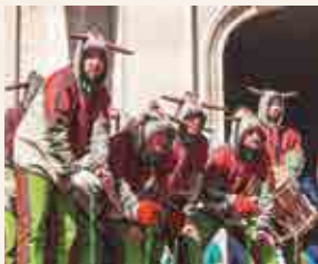
Versots dels Diables