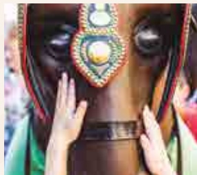
Tots som la Tecla

19 h , pl. de les Cols. Presentació del llibre Tots som la Tecla , de la periodista i fotògrafa tarragonina Laia Díaz. Un recull d'històries i fotografies de 60 persones que fan que la Festa Major de Santa Tecla de Tarragona sigui única. Imatges i persones al servei de la festa, la bibliografia festiva teclera creix!