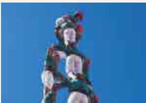
Castellers de Vilafranca