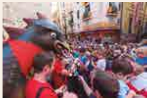
Dona el xumet a la Víbria.

18 h , jardins de Saavedra. Tallers familiars.