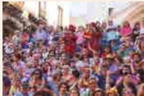
L'Anada a Ofici ©Laia Díaz

llada conjunta de tots els elements festius i els pilars de les colles castelleres, alhora que esclaten les salves pirotècniques d'homenatge seguides d'un ram de tro de la Pirotecnia del Mediterráneo, de Vilamarxant, Camp de Túria (País Valencià).