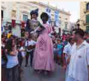
L'Arrencada dels Gegants

19.30 h. , des de la pl. de la Font. L'Arrencada dels Gegants. Després dels tres coets d'avís, arrenquen els gegants: gegantons Negritos, Gegants Moros, Gegants Vells de la ciutat o del Cós