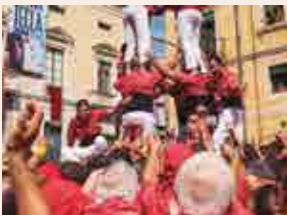
Colla Vella dels Xiquets de Valls