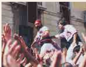
Colla Jove Xiquets de Tarragona © Laia Díaz