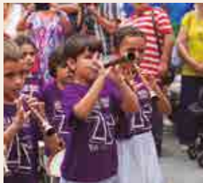
Entradeta de Músics

nal i Popular El Tecler, l'Aula d'Instrumentes Tradicionals de l'Escola Municipal i la Xarangueta Els Guirigalls.