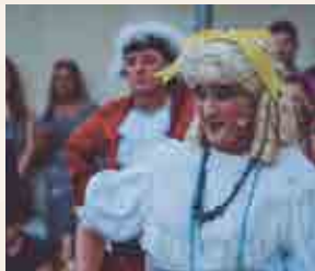
Dames i Vells

20.30 h , pl. Natzarens. Representació del Ball de Dames i Vells.