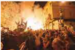
L'Entrada del Braç de Santa Tecla