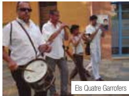
Els Quatre Garrofers

Ministrers, Grallers de l'Esperidió, Grallers de l'Alfàbrega, Grallers Tocaferro, Grallers Pelacanyes, Sacaires de Tarragona, Miña Cobla La Patuleia, Dolçainers Tresmall, Grallers Sonagralla, Grallers Els Quatre Vents, Grallers La Virolla, Sonadors Bufalodre, Faktoria Folk, Rodarboç Cobla de Ministrers i la Fanfara de Torredembarra.