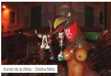
Xumet de la Vibria - Cristina Metu

18 h , parc de Saavedra. Tarda Fes-Tecletes . Ja arriba el concert "marca Minipop" de les Festes de la ciutat. L'Associació Tecletes, Mares