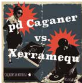
Caçadors de Bootlegs