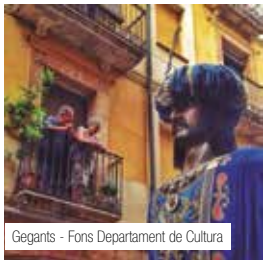
Gegants - Fons Departament de Cultura

Acte retransmès en directe per Tarragona Ràdio.