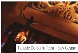
Retaule De Santa Tecla - Eloy Gaspar

22.30 h , Catedral. El Retaule de Santa Tecla . Representat per l'Esbart Santa Tecla i amb la música de la Cobla La Principal del Llobregat, dirigida per Jordi Núñez, és sens dubte un dels moments amb més càrrega emotiva de la nostra festa major. A través de la creació coreogràfica, descobrim la vida, conversió i martiri de la nostra patrona.