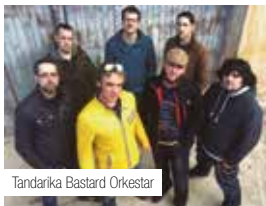
Tandarika Bastard Orkestar

que ha tombat per tot arreu amb el seu particular so d'origen balcànic. Després de molt caminar i tocar pels carrers i places d'arreu, volen oferir-nos un concert pensat per ser tocat dalt d'un escenari. Segur que aquesta nit trobarem l'Ebre i els Balcans més propers que no ens pensem!