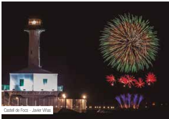
Castell de Focs - Javier Viñas