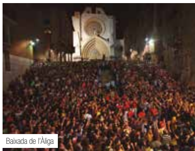
Baixada de l'Àliga