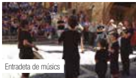
Entradeta de músics