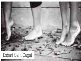
Esbart Sant Cugat

Organitza: Esbart Santa Tecla Col·labora: Ajuntament de Tarragona