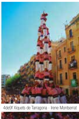
4de9f Xiquets de Tarragona - Irene Montserrat