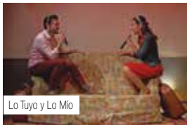
Lo Tuyo y Lo Mío

Preu: 16 €. Venda d'entrades: taquilla@salatrono.com -977 222 014.