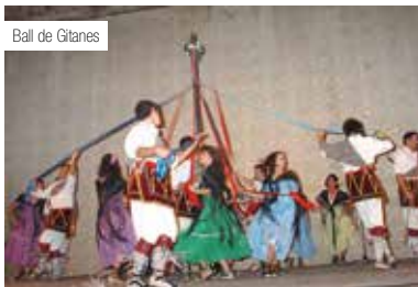
Ball de Gitanes

Organitza: Cal Blay - Hit Mediterranean Club