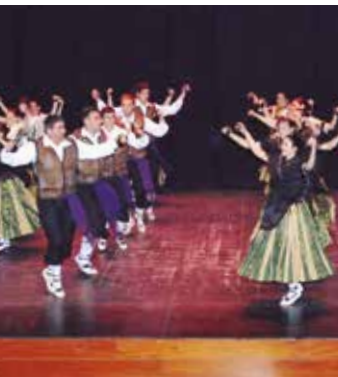
Esbart Dansaire de Tarragona

22 h , pl. de la Font. Festival de Dansa Catalana amb l'Esbart Dansaire de Tarragona. Un recorregut pel millor del seu repertori de danses tradicionals.