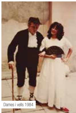
Dames i vells 1984

21.30 h , Teatre El Magatzem, Cooperativa Obrera Tarraconense, c. Fortuny, 23. El Mikado, Titipu Corporation S.A. L'Estudi de Música i la Cooperativa Obrera Tarraconense ens