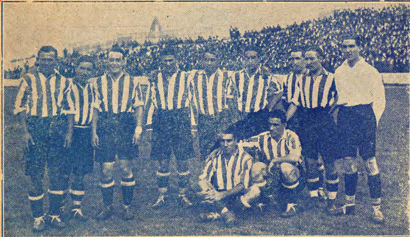
El formidable equipo del Athletic de Bilbao que jugará durante estas fiestas dos sensacionales partidos contra el Club Gimnástico en el espléndido Campo de la Avenida de Cataluña