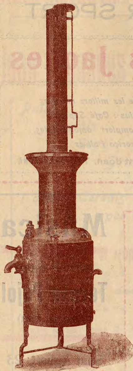
Estubadora per a bocois

Sant Agustí, 19 i August, 2 : Telèfon 195 : TARRAGONA