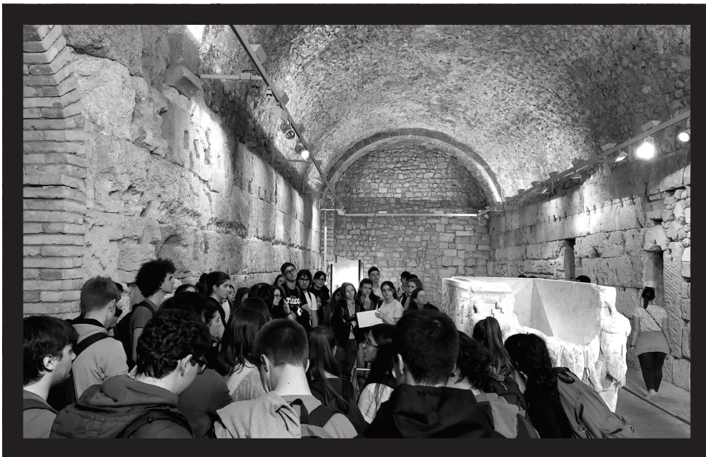
Explicacions a la sala dels condemnats a mort.

Només durant l'any 1939 es van internar més de 6.200 persones en les presons de Pilats, la Punxa i les Oblates, amb una mitjana d'ingressos mensuals de cinc-cents vint reclusos. L'any 1943 encara hi havia a la presó de Pilats 585 reclusos; un any més tard es registraven tres-cents quaranta interns i, al final de l'any 1945, el nombre d'empresonats s'havia reduït a dos-cents dotze.