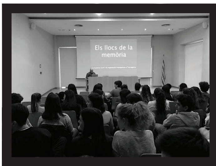
Presentació a la Sala d'actes dels Serveis Territorials de Cultura.

S'aprofita aquest preàmbul per a explicar la tècnica de la refotografia, en la qual hauran de participar els alumnes. És a dir, a partir de còpies de fotografies dels anys de la Guerra Civil que es faciliten, els assistents a la ruta han d'incloure aquesta imatge històrica en una fotografia captada per ells mateixos amb el seu aparell de mòbil, una acció que serveix per a traslladar al present una imatge del passat.