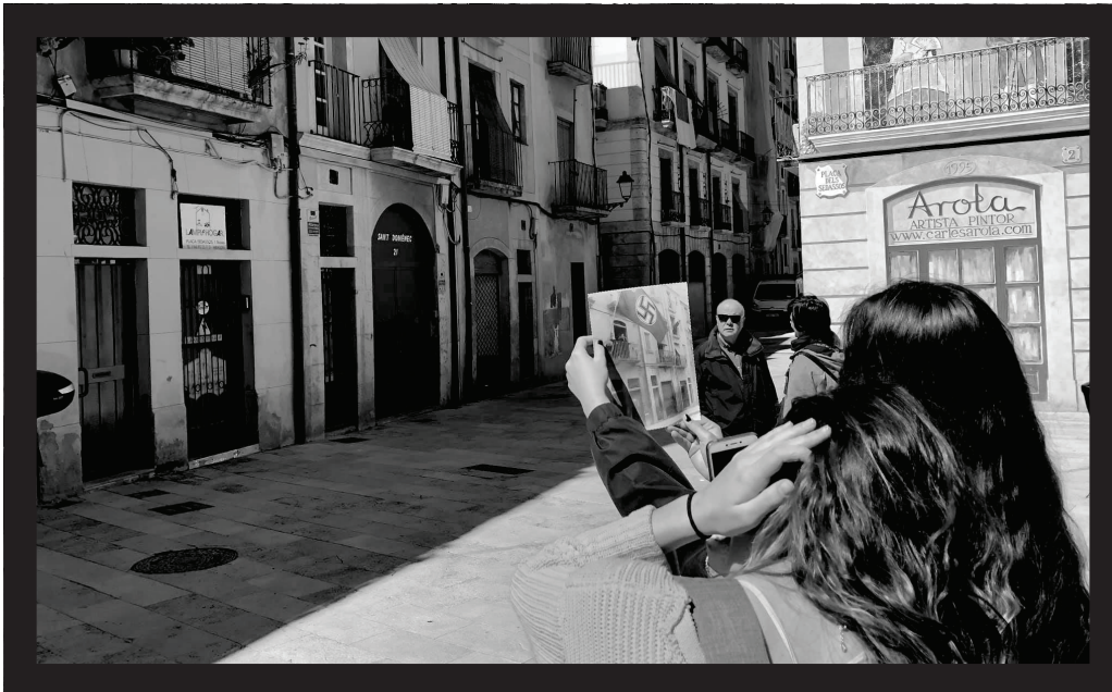
Alumnes retrofotografiant a la plaça dels Sedassos.