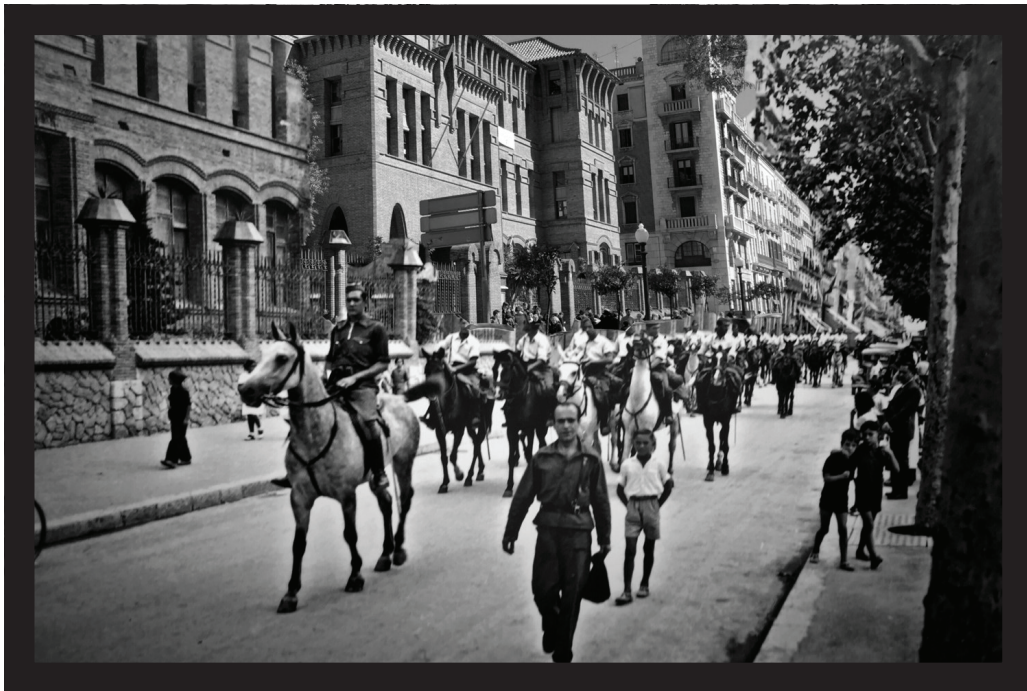
La cavalleria de les milícies del POUM passant per davant de la Casa del Poble, actual Col·legi de les Teresianes, setembre de 1936. Fotografia original d'Hermenegild Vallvé. Refotografia d'Esther Reverté Gras, de l'EADT.

defensa del règim republicà sinó el bandejament i la substitució del mateix per una nova organització social basada en l'administració obrera de l'economia. És a dir, es va impulsar una revolució proletària.