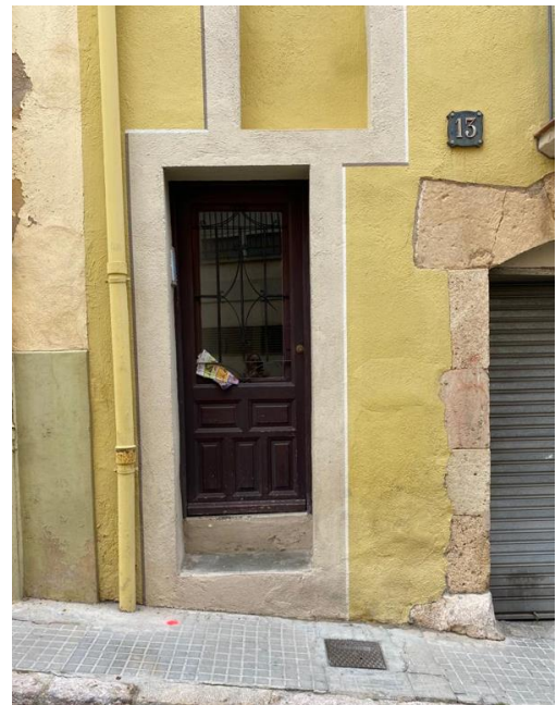
Cr. Puig d'en Sitges, 13 de Tarragona

Actualment, existeixen més de 60.000 stolpersteine distribuïdes en més de 1.800 ciutats de més de 20 països europeus com Alemanya, Àustria, Hongria, Països Baixos i a diferents municipis catalans, entre d'altres. A partir de l'any 2023, Tarragona s'ha afegit a aquest homenatge.