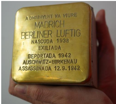
Llamborda de la memòria

Stolpersteine paraula alemanya que significa pedres, llambordes per ensopegar. Les stolpersteine o llambordes de memòria són petits monuments creats per l'artista alemany Gunter Demning en memòria de víctimes del nazisme. L'artista vol que aquestes llambordes "no siguin per ensopegar amb els peus, sinó amb el cap i el cor".