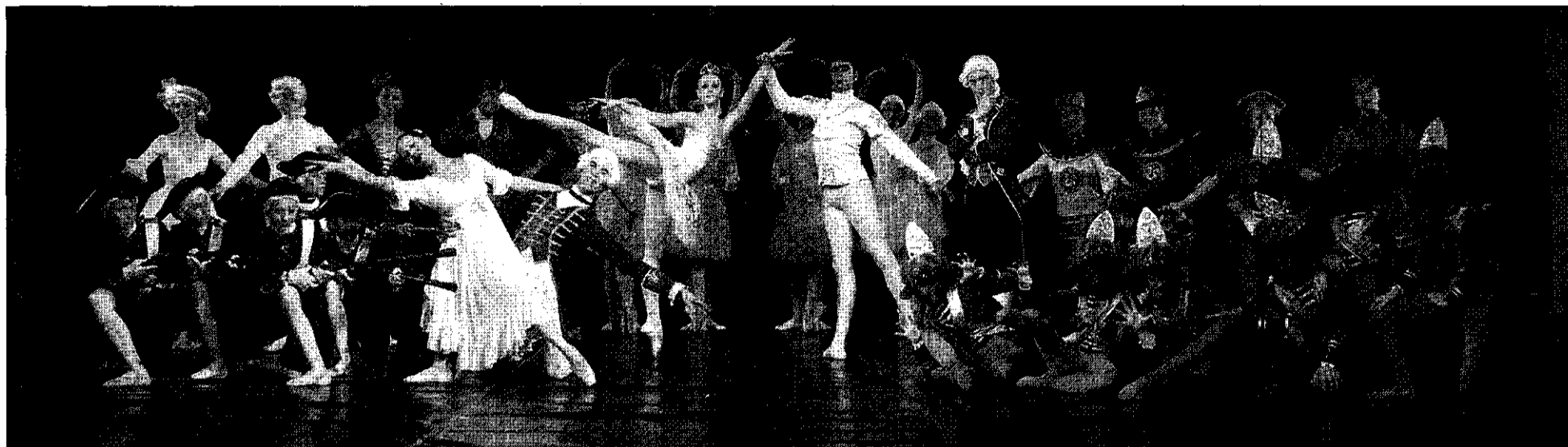
El espectáculo 'Cascanueces', interpretado por más de veinte artistas del ballet estatal ruso, llegará al Palau de Congressos de Tarragona, el domingo día 2 de enero.

MÚSICA ■ CUATRO ESPECTÁCULOS IDÓNEOS PARA EL PÚBLICO FAMILIAR