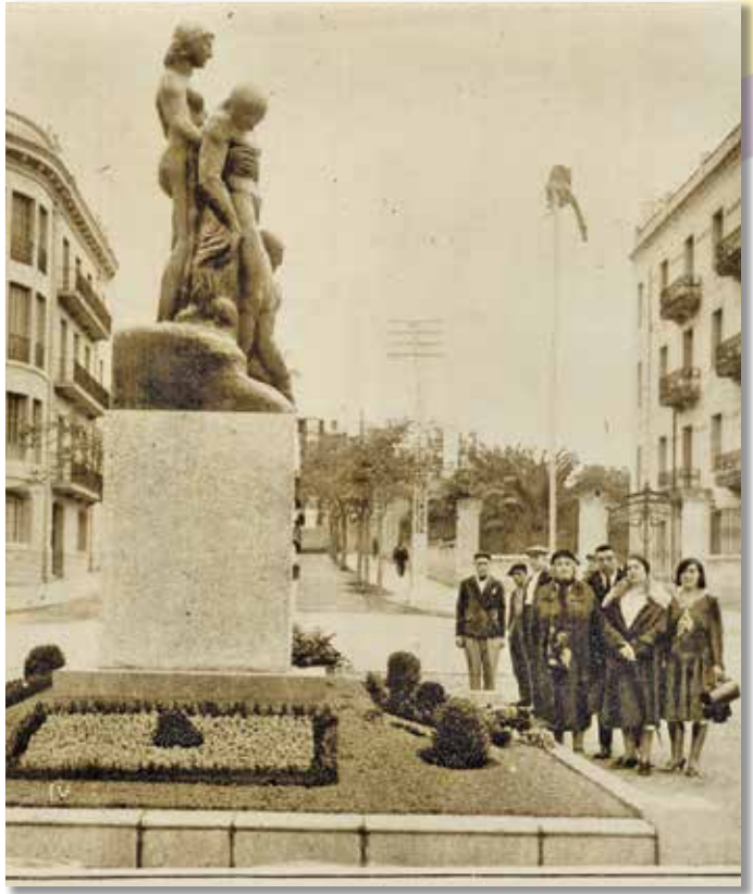
Familiars de Julio Antonio el dia de la inauguració del monument, 24 de setembre de 1931.

No va ser fins al 1931 que s'inaugurà l'escultura a la Rambla. Va ser un dels primers actes organitzats per l'Ajuntament republicà, aprofitant les festes de Santa Tecla.