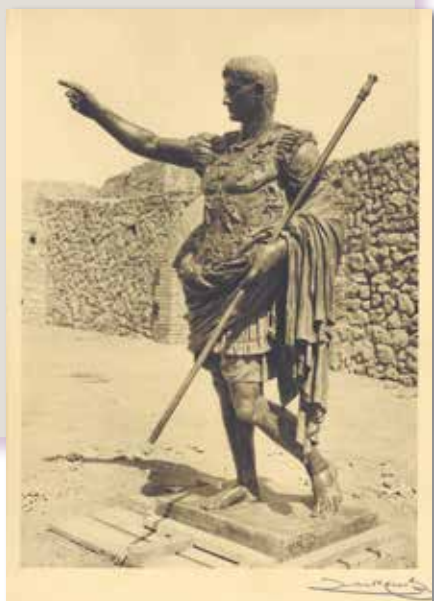
Estàtua d'August, 1934. Foto Zerkowich. CIT

El 3 d'agost de 1934 va arribar al port de Tarragona a bord d'un vaixell i procedent d'Itàlia, l'estàtua d'August. L'escultura de