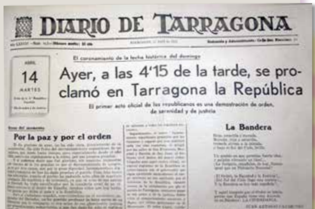
Diario de Tarragona, 15 d'abril de 1931.