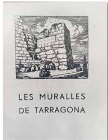
Portada de l'opuscle Les Muralles de Tarragona d'Antoni Rovira i Virgili.

Les antigues muralles que avui Tarragona honora i agença, són el millor ornament de la ciutat i el més ferm testimoni de la seva llarga vida a través de races i pobles i guerres i civilitzacions. Tarragona, vella de més de dos mil anys, guaita en aquestes muralles els senyals de la seva evolució històrica Amanyagada de la mar i el sol", com digué el poeta Marcial, la nostra ciutat mostra els rengles de pedres daurades sota la clara blavor del seu cel alt, vora la blavor intensa de les seves