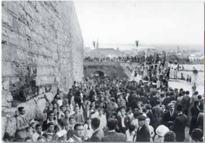
Inauguració del Passeig Arqueològic, 22 d'octubre de 1933.

L'Ajuntament va aprofitar l'ocasió per publicar un llibret titulat Les muralles de Tarragona , escrit per Antoni Rovira i Virgili, amb dibuixos a la ploma de Lluís Mallafré i Lluís Saumells i fotografies de Màrius de Bucovich. Un fragment d'aquest text remarca el valor de la muralla i el nou passeig: