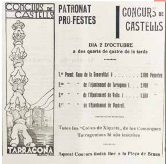
Anunci del primer concurs de castells Diari de Tarragona, 2 de setembre de 1933. BHMT

El 2 d'octubre va tenir lloc, a la plaça de braus, el primer concurs de castells que van guanyar la Colla Vella de Valls.