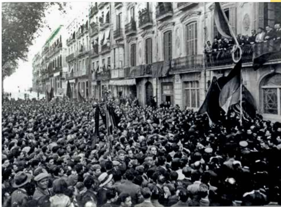
Manifestants davant el Govern Civil, 1931. Foto Vallvé. CIT