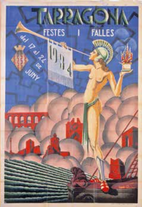
Cartell de les Festes i Falles, 1934.