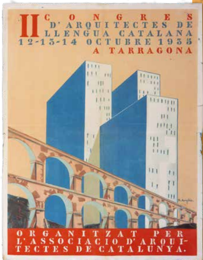
Cartell del II Congrés d'Arquitectes en llengua catalana, 1935. BHMT

L'Associació d'Arquitectes de Catalunya organitzà el Segon Congrés d'Arquitectes en llengua catalana, els dies 12 al 14 d'octubre de 1935. Durant els mateixos dies se celebrava el Tercer Congrés d'odontòlegs de llengua catalana.