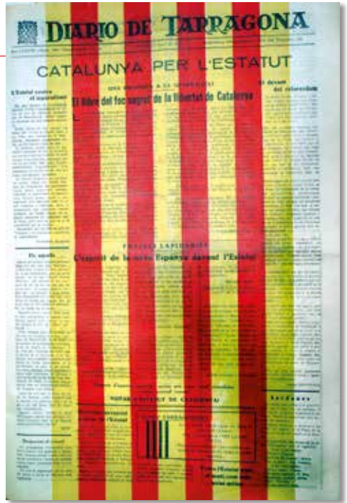
Diari de Tarragona de l'1 d'agost de 1931. BHMT

El mateix dia va tenir lloc un homenatge a Àngel Guimerà i a Santiago Rusiñol, amb el descobriment de dues làpides als, fins aleshores, carrer Sant Agustí i la Plaça de les Cols respectivament.