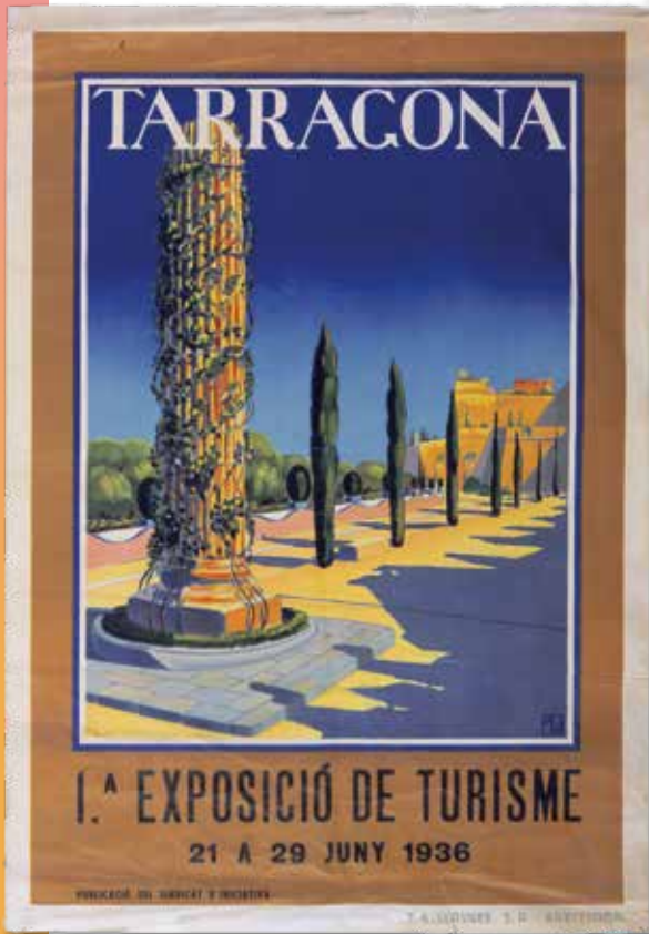
Cartell de la 1a. exposició de turisme, 1936. BHMT

per la seva actuació durant els dies que els presos polítics van estar detinguts al vaixell Manuel Arnús.