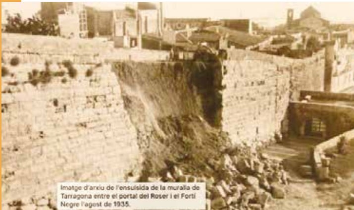
Esllavissada de la muralla, agost 1935

El 19 d'agost de l'any 1934 s'inauguraren els primers xalets de la vileta de mar "Sol Ixent" a la platja de l'Arrabassada.