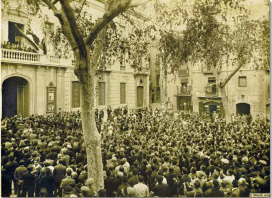
Manifestants davant l'Ajuntament, 1931. Foto Vallvé. CIT

Ínutil recomanar màxima serenitat en totes les manifestacions i entusiasmes. La causa i el crèdit de la república és l'ordre dintre de la llei i de la justícia.