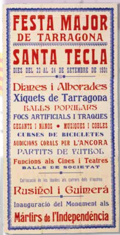
Cartell de les festes de Santa Tecla on s'anuncia la inauguració del Monument als Herois de 1811, 1931.

Amb motiu de la commemoració del centenari, el 1911, l'Ajuntament va convocar un concurs per bastir una escultura. El guanyador va ser Julio Antonio, escultor de Móra d'Ebre. En l'obra es deixa de banda el relat històric amb l'exèrcit, els soldats i les armes de foc com a figures principals, per representar una al·legoria de la ciutat i de tots els ciutadans que van patir el setge, un concepte diferent i nou.