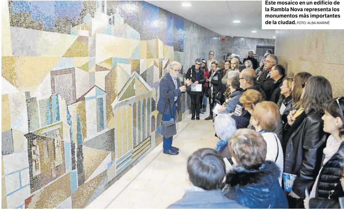
Este mosaico en un edificio de la Rambla Nova representa los monumentos más importantes de la ciudad.

Vitres y mosaicos. Una ruta permite conocer las obras que el autor de la cúpula de El Valle de los Caídos realizó en la ciudad. Algunas están más cerca de lo que piensa