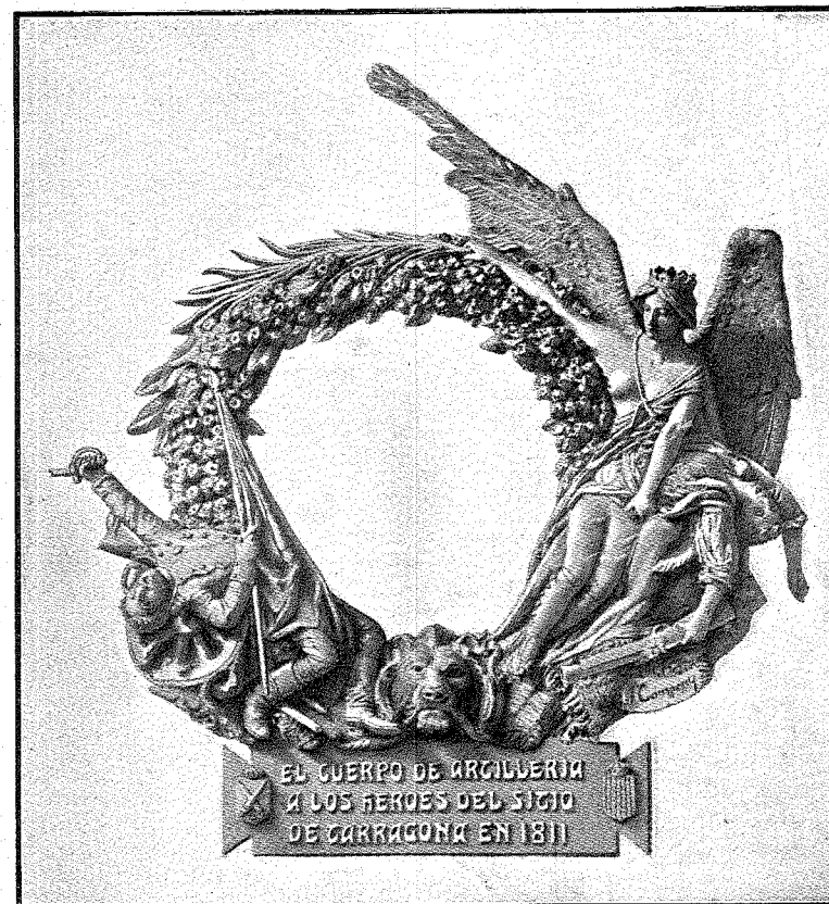
Corona ofrecida por el Cuerpo de Artillería á la memoria de los héroes del Sitio.

El Ayuntamiento de Tarragona, por último, ha expresado de oficio á la Comisión del Cuerpo de Artillería la gratitud que le ha merecido la cooperación de nuestra Arma al brillante resultado de las fiestas que acabamos de reseñar ligeramente, cumplimentando así un acuerdo adoptado unánimemente por dicha Corporación municipal en sesión de 14 de julio próximo pasado.