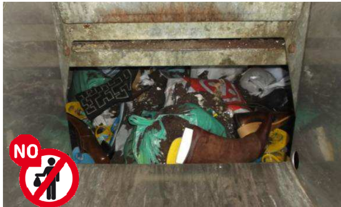
Fotografia de l'interior d'un contenidor d'orgànica soterrat.