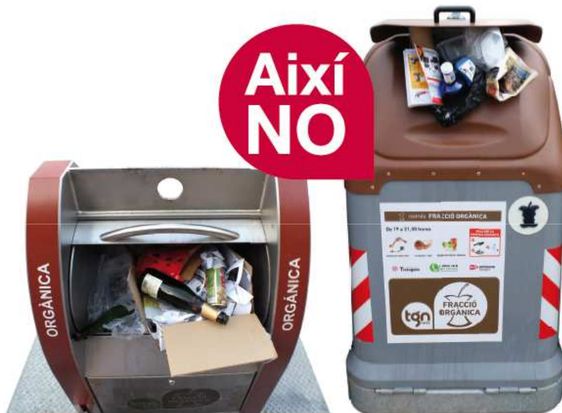
Simulació d'una separació de residus incorrecta