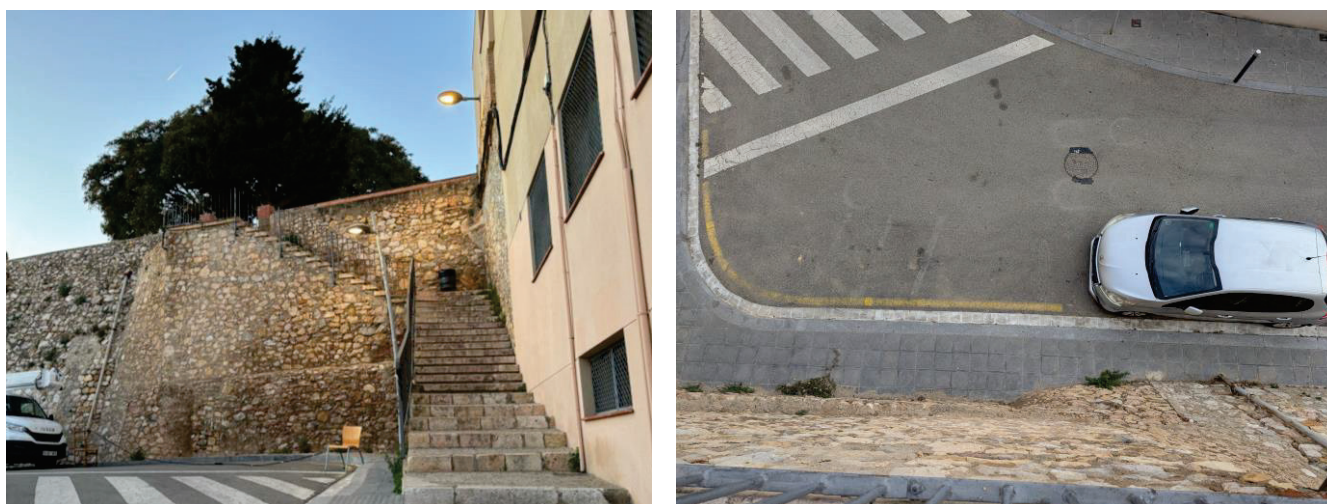
Il·lustració 1: Escalles i vista superior del punt on cal instal·lar l'ascensor.

En diverses ocasions, veïnes i veïns de la zona s'han mobilitzat i contactat amb tècnics municipals reclamant un ascensor i una rampa mecànica que permetin millorar la connectivitat d'aquesta zona, recollint, fins i tot, prop de 500 signatures.