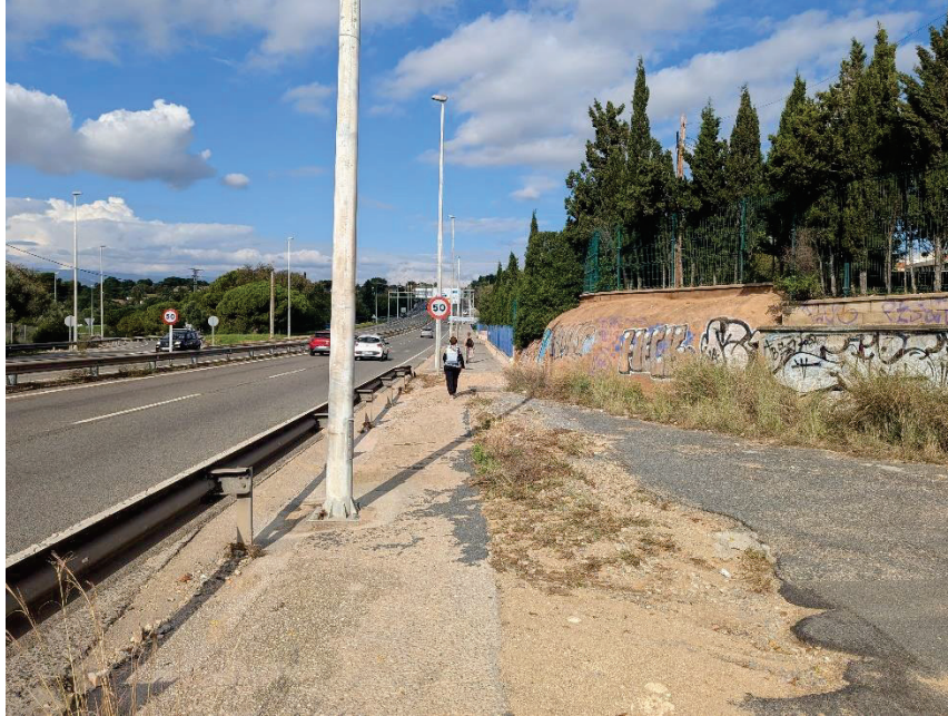
Imatge 3 de l'itinerari entre Eixample Nord i la variant que porta a Països Catalans