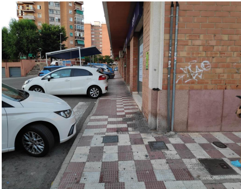
Voreres estretes envaïdes pels vehicles