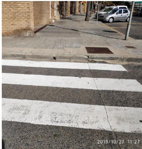
Passos de vianants no adaptats, amb voreres no rebaixades