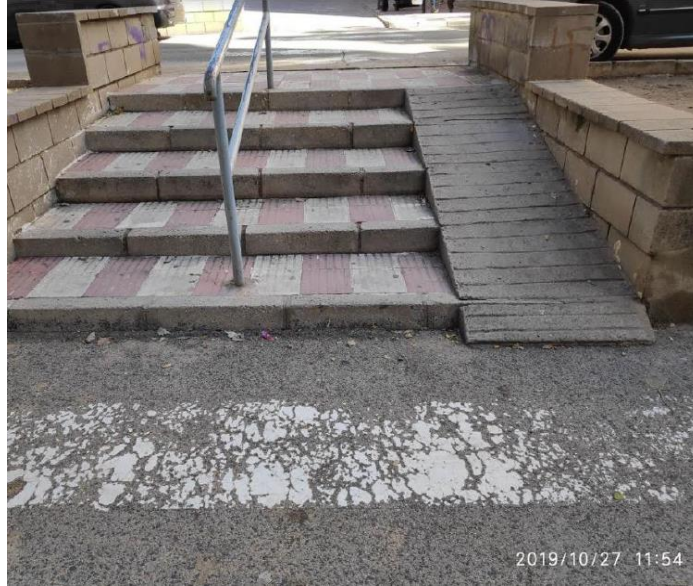
Rampes fora de normes