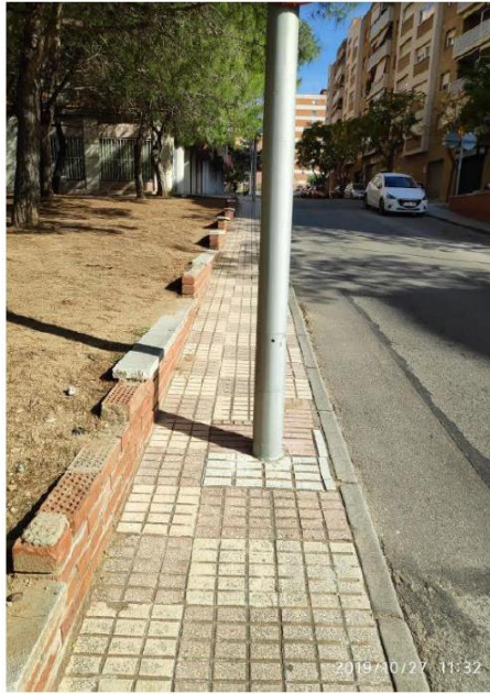
Voreres estretes amb un fanal enmig