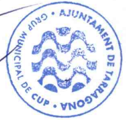
Laia Estrada Cañon Portaveu del Grup Mpal. de la CUP