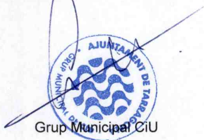
Grup Municipal CiU