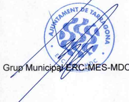
Grup Municipal ERC-MES-MDC