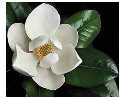
Magnolia ( Magnolia grandiflora )