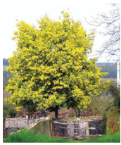
Mimosa ( Acacia dealbata )