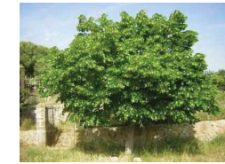
Til·ler ( Tilia europaea )