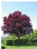
Prunera ( Prunus pissardii )