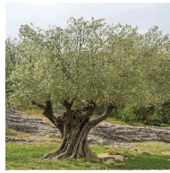
Olivera ( Olea europaea )