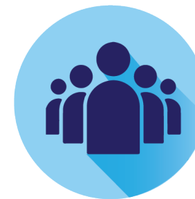
Ciutadania i inclusió