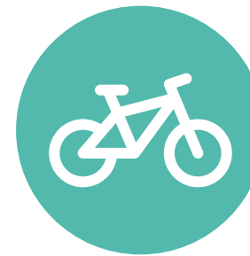
Esports i mobilitat