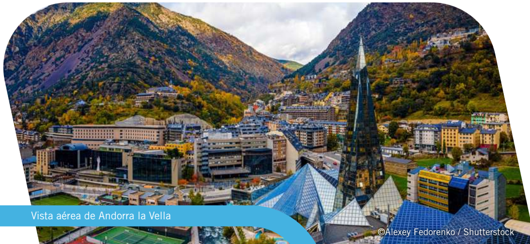
Vista aérea de Andorra la Vella