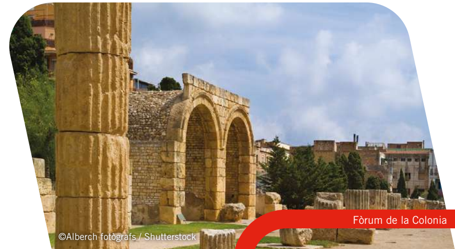
Fòrum de la Colonia