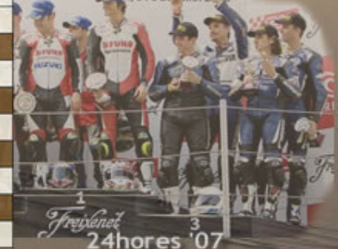
1 Freixanet 24hores '07

ES FRIGO DE MOTOCICLI' ME 4, 5 i 6 de juliol 2008