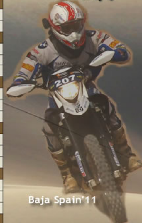
Baja Spain '11

ES FRIGO DE MOTOCICLI' ME 4, 5 i 6 de juliol 2008