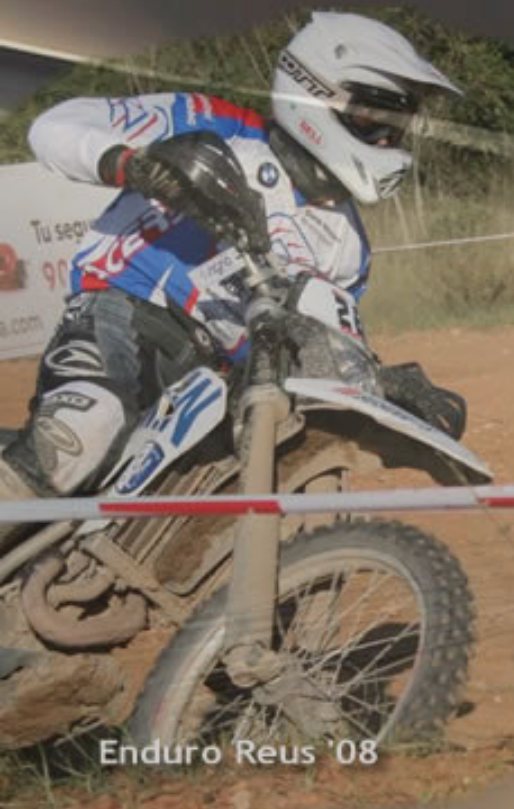
Enduro Reus '08