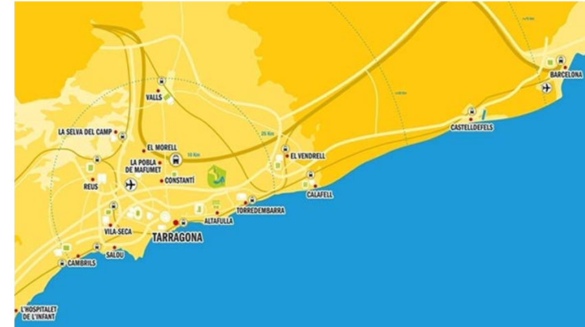
Els Jocs Mediterranis Tarragona 2017, un Jocs del territori

Aquest document marca la finalització de la fase de diagnosi del procés de planificació estratègica del llegat i el full de ruta que ha de servir al territori de base per definir quins han de ser els projectes estratègics de llegat que s'han de potenciar o consolidar en els propers anys, posant els Jocs Mediterranis al servei del territori , integrant els Jocs en els projectes i les polítiques del territori per que actuïn com a catalitzador aprofitant el momentum de l'esdeveniment i contribueixin als projectes de desenvolupament local .