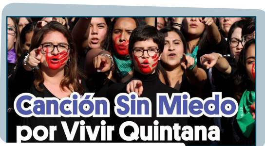
Canción Sin Miedo por Vivir Quintana