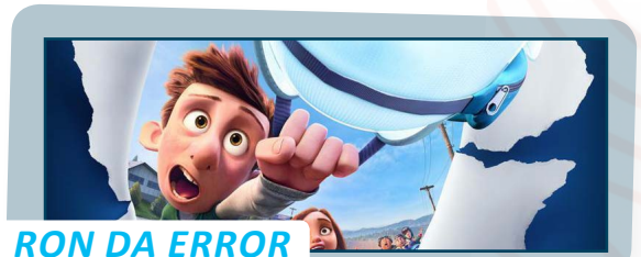
RON DA ERROR

Els minions són ingenus i, acompanyats pel rebel Stuart i l'adorable Bob, comencen un viatge per aconseguir tenir una persona al seu costat.