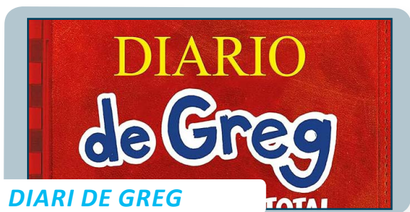
DIARI DE GREG

Novel·la infantil i juvenil. Són aventures plenes de sorpreses. No hi ha armes, violència, alcohol, tabac, jocs d'atzar, caça, comportaments de menyspreu per la seguretat, racisme. Transmet valors bonics per als infants i joves.