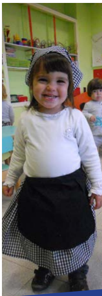
Mireu, mireu quines castanyeres més eixerides tenim a l'escola

Avui a la classe de la Cucafera ens toca fer un mural molt gran amb els colors de la tardor.