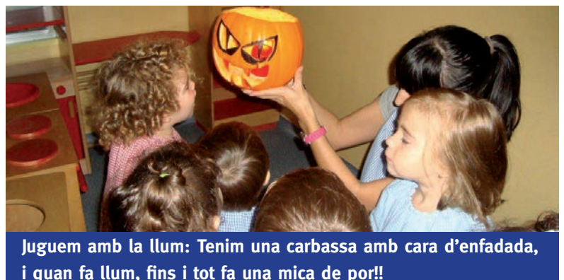
Juguem amb la llum: Tenim una carbassa amb cara d'enfadada, i quan fa llum, fins i tot fa una mica de por!!