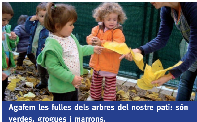
Agafem les fulles dels arbres del nostre pati: són verdes, grogues i marrons.