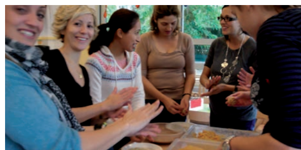
Fem panellets plegats