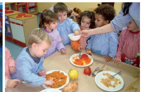
Tastem els fruits de la tardor: magranes moniats, codonys, caquis, raïm, taronges...