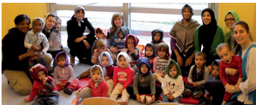
Les famílies ens visiten vestides de Castanyeres