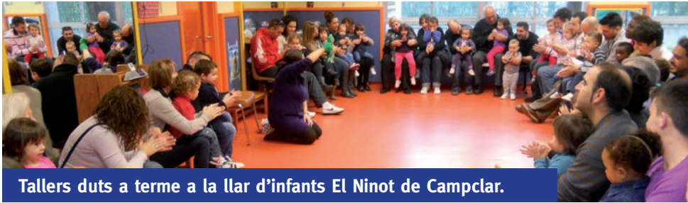
Tallers duts a terme a la llar d'infants El Ninot de Campclar.