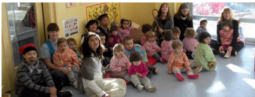
Els alumnes de l'Escola Cèsar August vestits de Castanyeres ens visiten