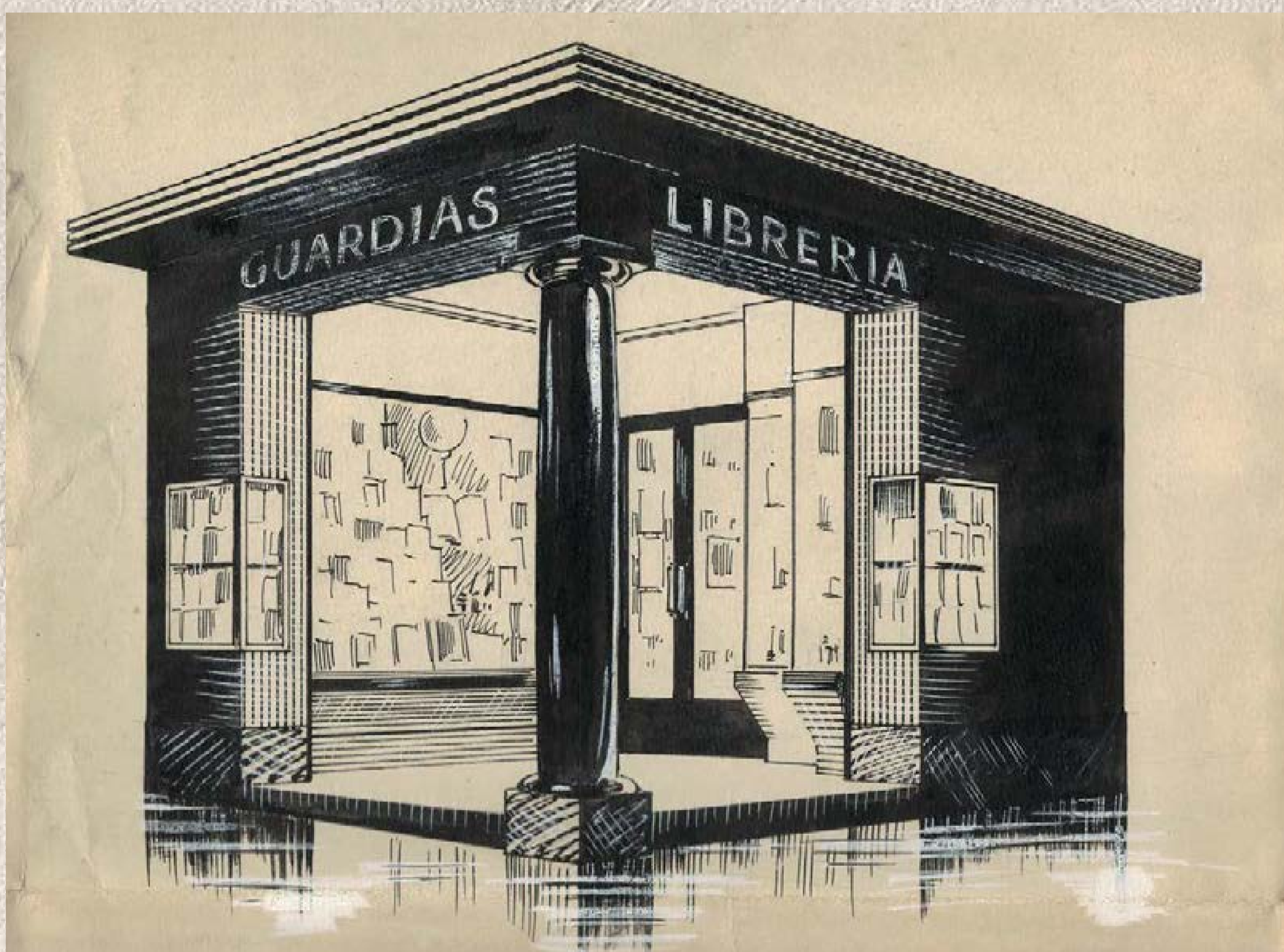
Croquis de la façana de la Llibreria Guàrdias a la plaça de la Font, 53. Any 1935.