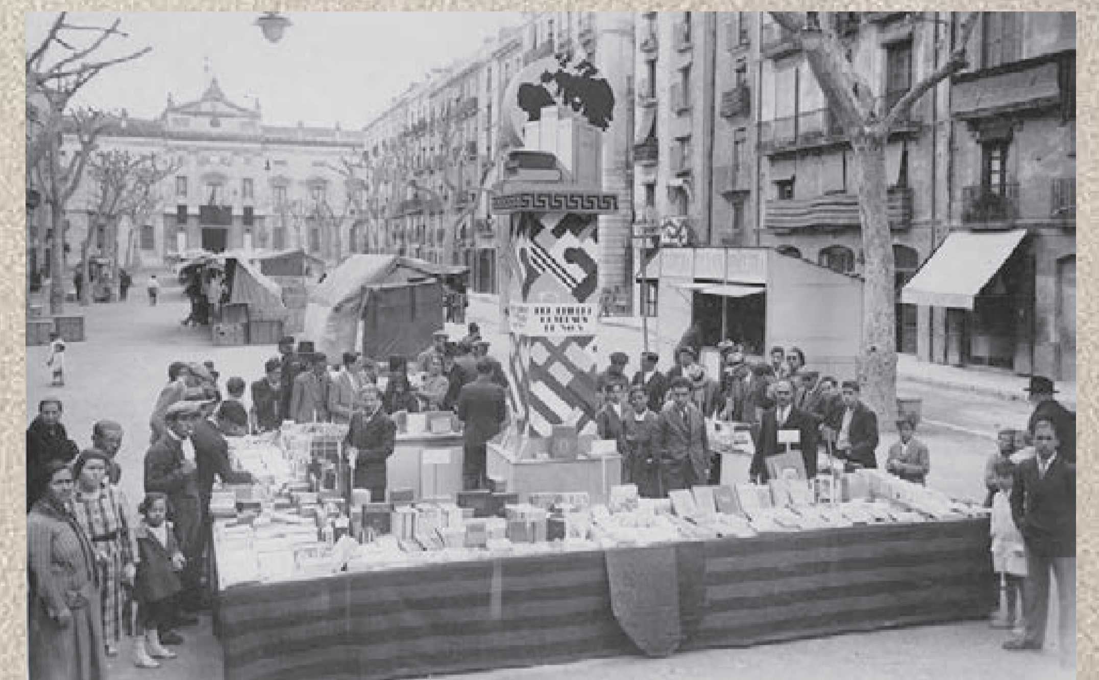
Imatges corresponents a la parada de llibres, davant la llibreria, a la plaça de la Font, el dia de St. Jordi, durant la II República. En una de les fotos, de 1932, s'hi pot distingir el poeta i llibreter junt a l'alcalde Pere Lloret; en les altres es veu una imatge general de la parada, amb la llibreria en una cantonada.