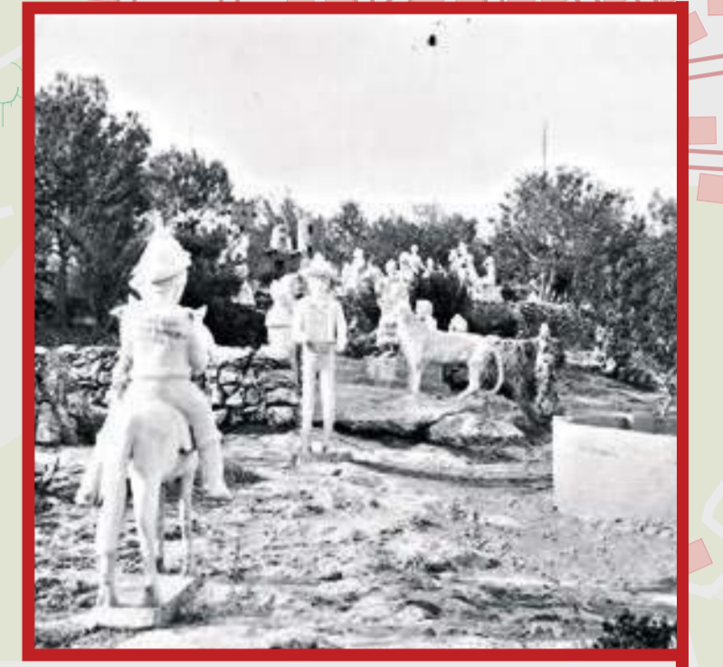
El Mas de les Figures