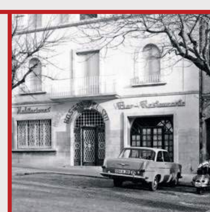
Portal de Sant Antoni

"Cada dia agafa uns prismàtics i una bossa amb aigua i un parell d'entrepans, i s'instal·la en algun dels seus observatoris; avui a l'últim pis de l'Hostal del Món."