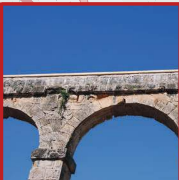
El Pont del Diable

"En la memòria dels més vells de Tarragona, el Mas de les Figures evoca la fantasia de qui va poblar d'escultures el bosc pròxim al seu mas prop de la ciutat. Poc després de la guerra fou abandonat i de seguida saquejat i les escultures malmeses."