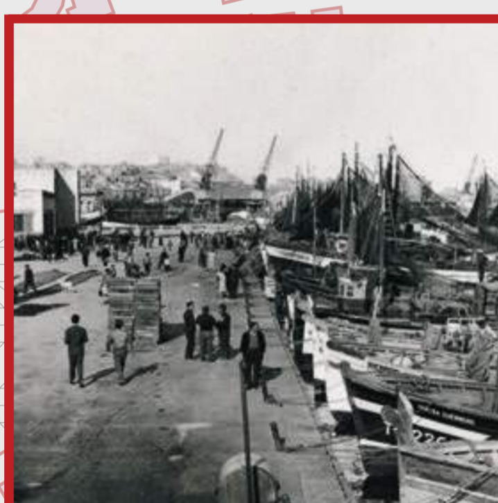
El Serrallo

"I llavors algú va dir que algunes famílies d'aquell tram de la Rambla havien dit que si finalment l'hi posaven marxarien perquè no estaven disposades a veure-li cada dia el cul a la dona i encara menys els d'aixonses del paio."