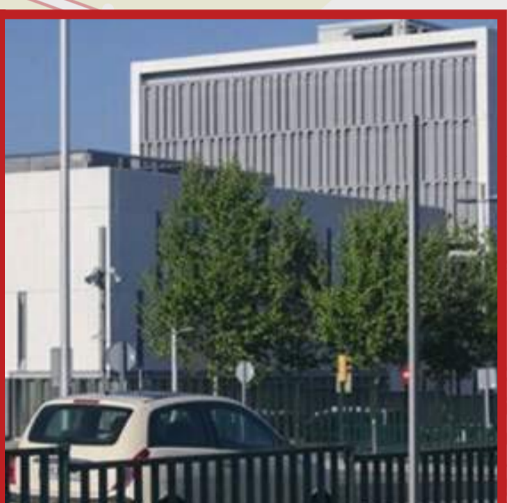
Comissaria dels Mossos a Campclar

"La ciutat, a desgrat de les Torres Roma o altres edificacions modernes, continuava sota la mirada de la catedral."