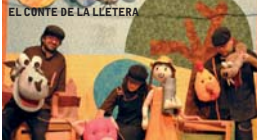
EL CONTE DE LA LLETERA