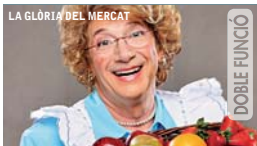
LA GLÒRIA DEL MERCAT