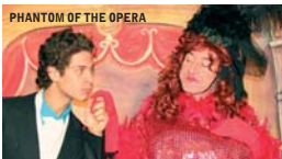
PHANTOM OF THE OPERA