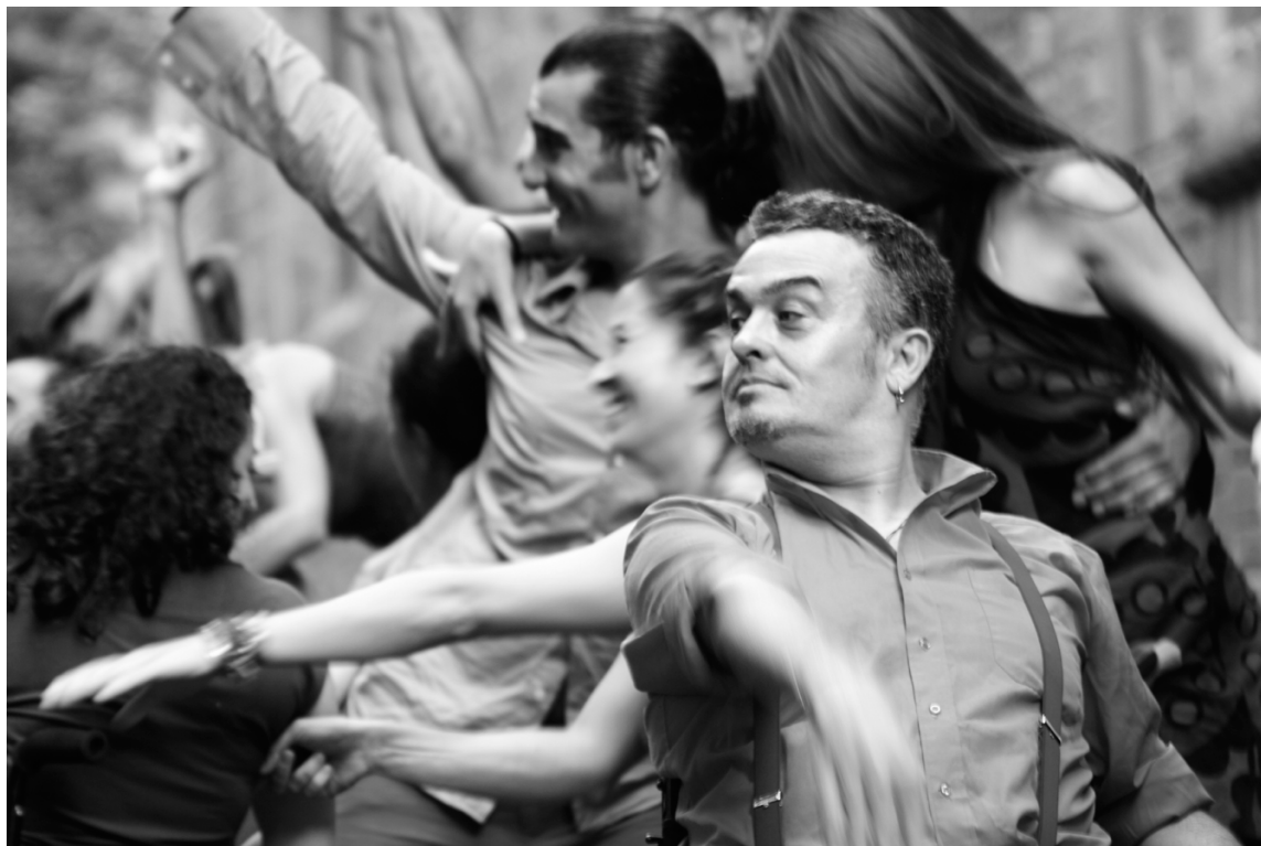
P.J.B. de Liant la Troca./ JOAO CARVALHO ©.

Liant la Troca és un grup de dansa integrada constituït l'any 2011 a partir dels tallers dirigits per Jordi Cortés i organitzats per Patricia Carmona a l'espai La Troca del Roca Umbert de la ciutat de Granollers.