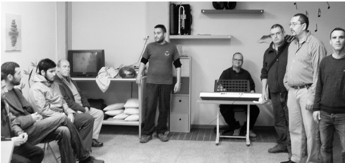
Els actors de la companyia La Muralla durant l'assaig del musical La Voz .