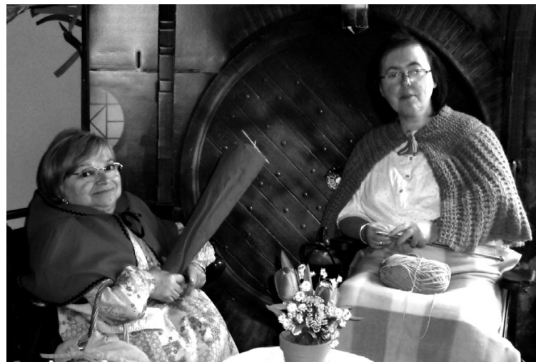
El love del llop . / RODAVLAS ©.

P er la seva banda el grup de teatre Rodavlas reescriu el famosíssim conte de la Caputxeta vermella, en aquesta ocasió ple d'intrigues i d'amors impossibles. "Què passaria si el conte que sempre ens han explicat no és cert del tot? Si els dolents no són tan dolents i els bons tan bons com ens fan creure?" Vine i comprova com les apereces, molt sovint, enganyen! ◊