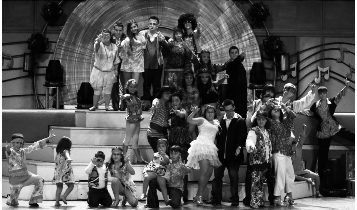
La síndrome del ball./ DOWN WAPACHA TEAM ©.

J a fa temps que l'Escola de Ball Wapacha de Reus i l'Associació Down Tarragona s'han lliurat a una pràctica exemplar formant a parelles de joves per competir en els certàmens de ball esportiu amb èxit. No cal dir que el platejament esdevé un element d'integració bidireccional (o tridireccional, si comptem el públic) on la síndrome de Down és visualitzada en el millor dels contextos, com és l'experiència vital de moviment harmoniós. Tot i un llarg palmarès, per primer cop a Tarragona.