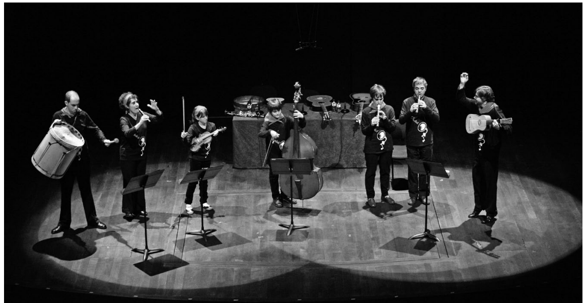
Tirabol a l'Auditori Nacional de Barcelona, 12 de novembre de 2009.

D'altre banda, la Coral Aprodisca , vinguda de Montblanc, ha escollit 9 peces que van de Haëndel i Beethoven al cançoner popular, per la seva intervenció que anomenen La nostra il·lusió es cantar , tota una declaració d'intencions.