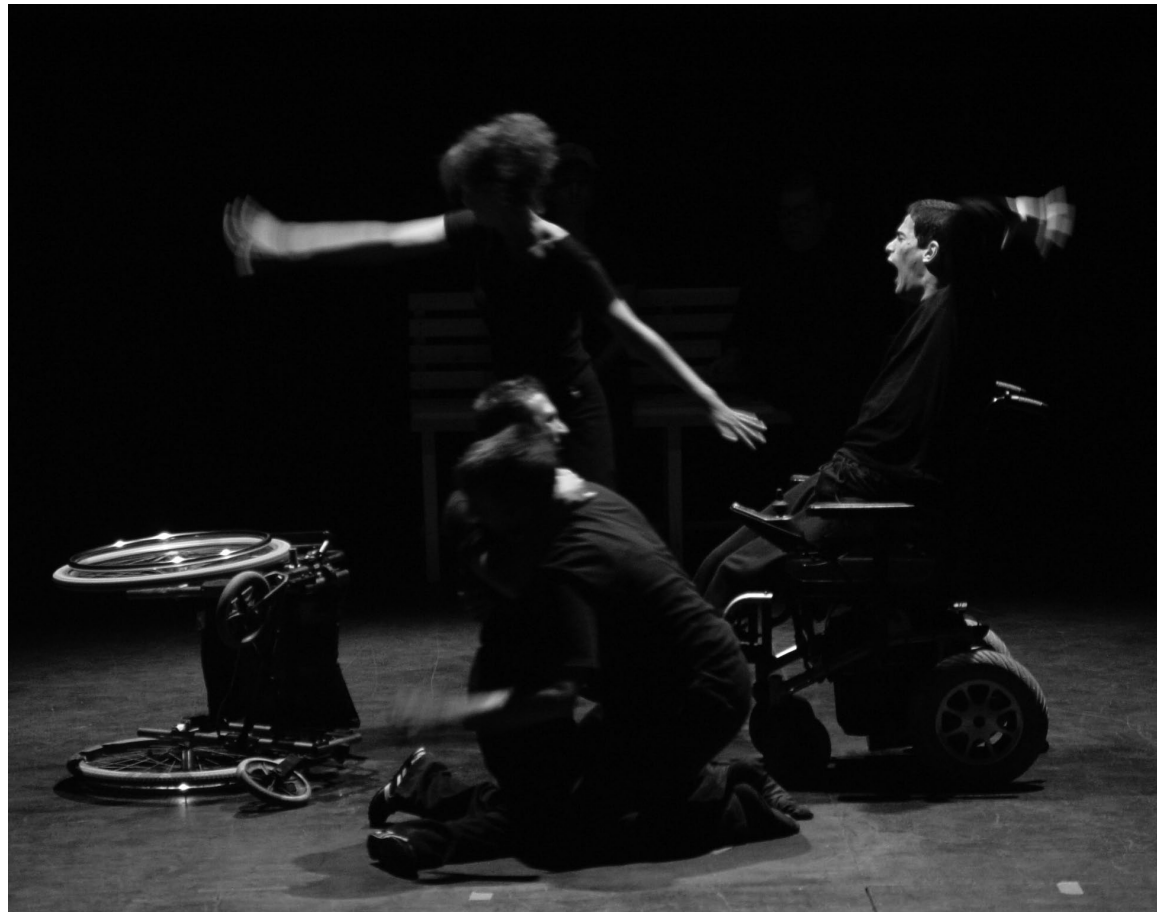
El crit de guerra. / AL TROT TEATRE ©.

Amb la col·laboració especial de: Agustí Forner i Xavi Corbella.