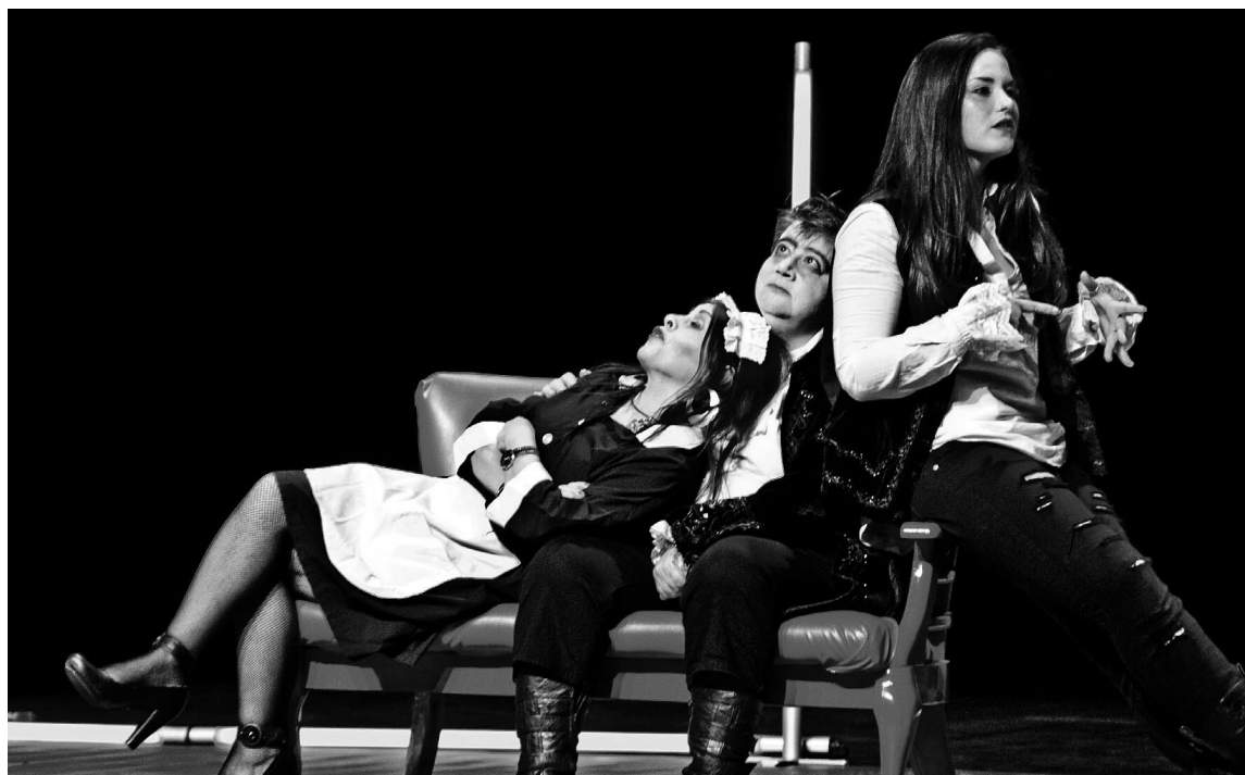
Amanida Teatre en escena.

mostrarà la varietat, diversitat, notorietat i exclusivitat que es pot donar davant aquest esdeveniment. Pensar en la mort ens ha de despertar per afrontar amb il·lusió aquesta curta vida. ◊