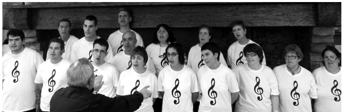
Coral Aprodisca.

No hi seran sols, ja que el tarragoní Estudi de Música, amb les seves Aula de Can Coral i Aula d'Alumnes amb Necessitats Especials, aportaran la instrumentació en aquesta mena de producció o, si més no col·laboració, promogudes des del mateix festival, acomplint un dels seus objectius més desitjats. ♦