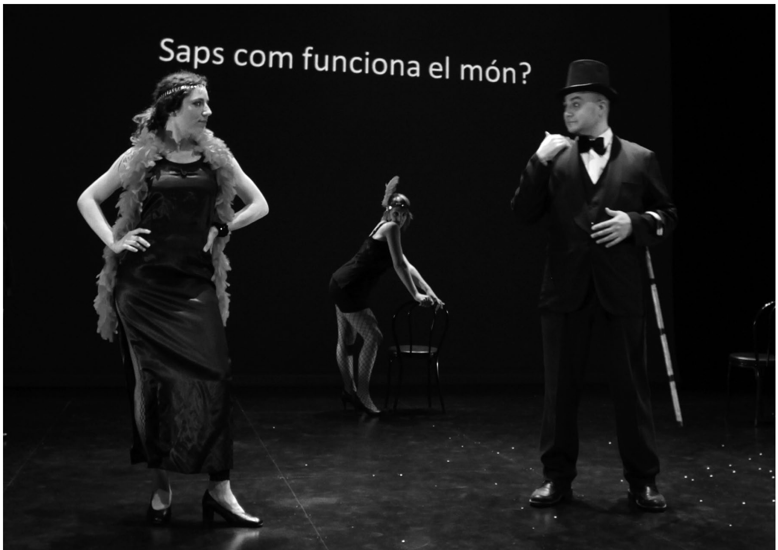
Un moment de l'espectacle Cabaret en llengua de signes.