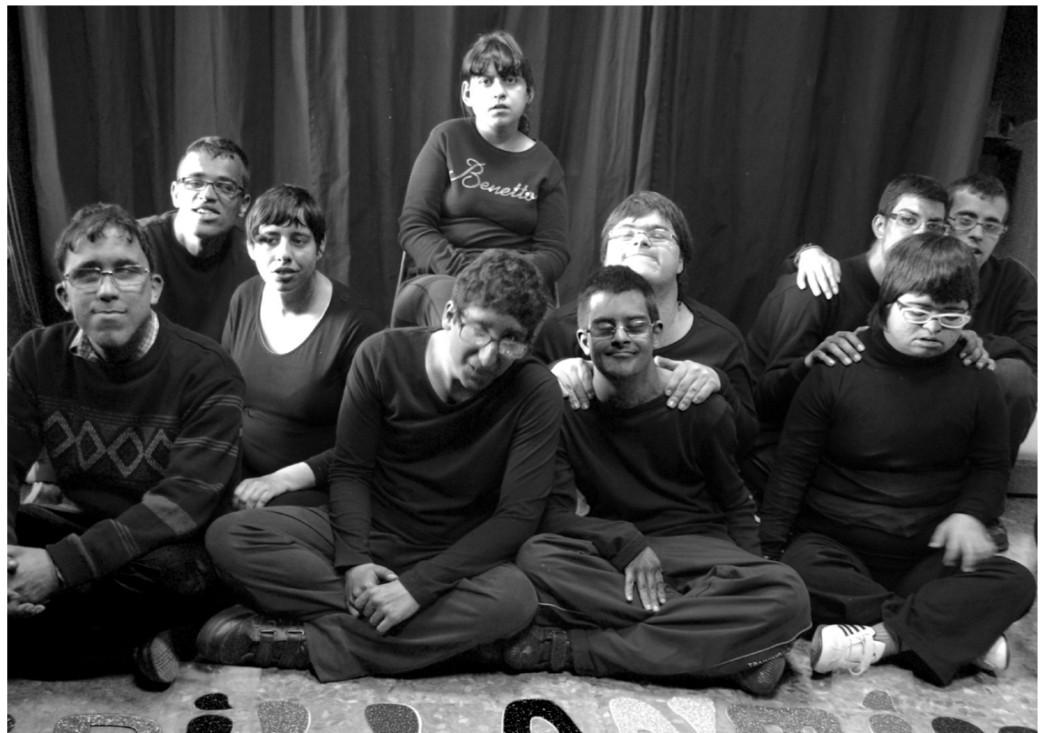
Nois i noies del STO SOLC.

L' Escola Solc presenta la peça teatral Un dia amb els Simpson : "Dos germans viuen absorbits per tot allò que fa referència als Simpson i no estudien ni fan la feina de cada dia. Com a terapia de shock el seu pare convida els Simpson a venir a passar un dia amb ells." Tot seguit, el Taller Solc presentarà el musical Tina : "A finals dels 60 neix Tina, una pilota rodona, simpàtica i riallera que inicia un llarg viatge per tal de saber quina es la seva autèntica vocació. En el viatge coneixerà altres pilotes fins a descobrir finalment qui és ella en realitat. Perquè en aquest món tots tenim un lloc, només hem de trobar-ho per saber qui som! ◇