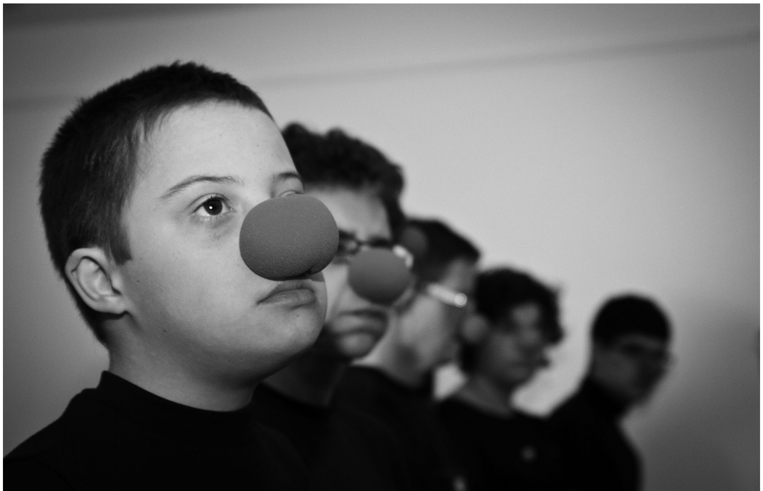
Teatre Ganyotes.

Senyores i senyors, benvinguts a 3/4 de circ!