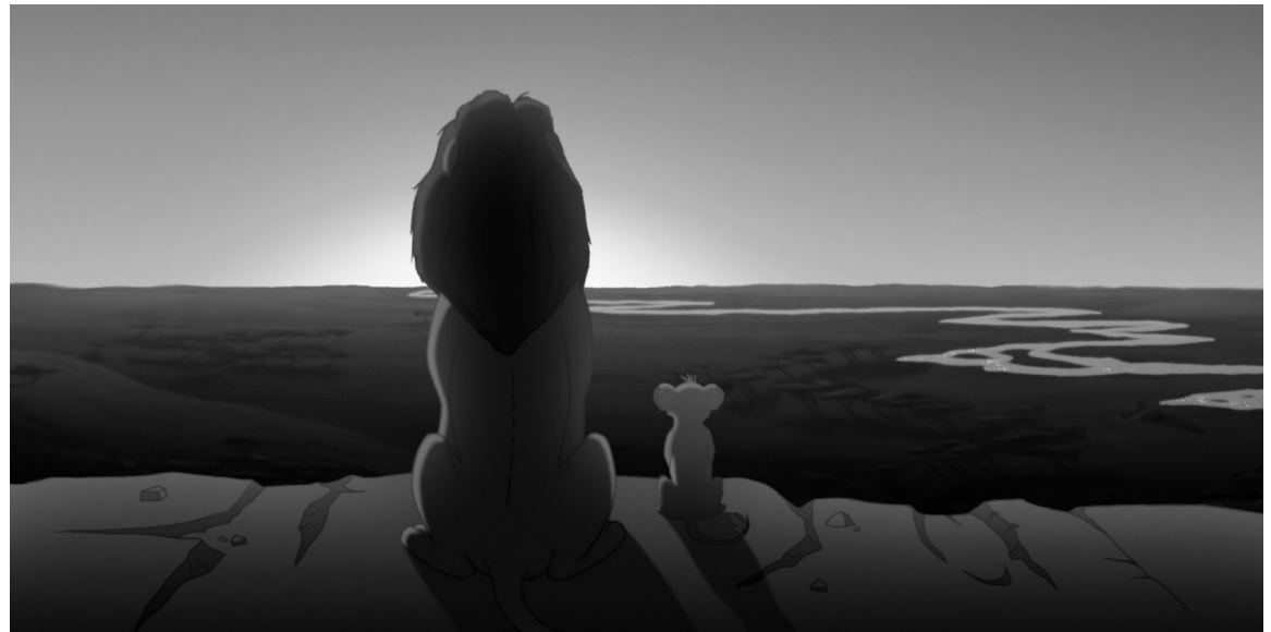
Fotograma de la pel·lícula El rei lleó .

L'argument que dibuixent els del Sant Rafael deixa veure coincidències amb la realitat actual: "El petit Simba