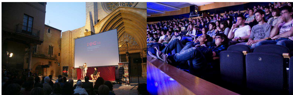
Imatges ambient – REC'11 - Tarragona

En definitiva el pròxim novembre gaudirem de més pel·lícules, més nous directors, més descobriments, més emocions, més cinema. Més REC.