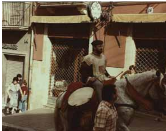
El Magí de les Timbales pujant per la Baixada de la Misericòrdia, any 1984.

seda vermella” i uns anys després, allà pel 1924, en una vella i sentida poesia el Pare Iglesias considerava l'emblemàtic timbaler com el més original dels personatges del seguici popular a qui qualificà també d'herald del nostre poble 2 .