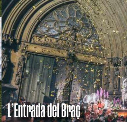
L'Entrada del Braç