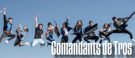
Comandants de Tros