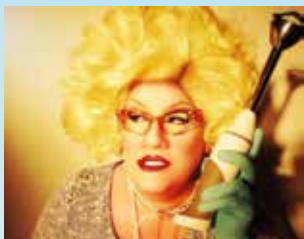
La Mega Pubilla