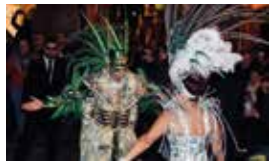
Entrada del Rei Carnestoltes i Concubina.

Ho organitzen: comparses Nou Ritme i Cromàtic Fusion