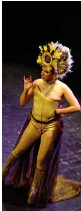
Certamen Drag Queens.

Ho patrocinen: Tarragona Ràdio, Totem Cafè, Disco Totem, diari La República Checa , Casino, Lexus i Gimnàstic de Tarragona.