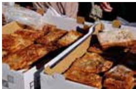
Coca de llardons.

9 h. Inici del Tombet del Rei Carnestoltes i la Concubina per les diferents escoles i llars infantils.