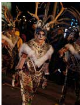
Rua de Lluïment.