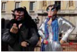
Presentació del Ninot i la Ninota.

Ho organitza: Associació per a la Conservació de Figures Festives