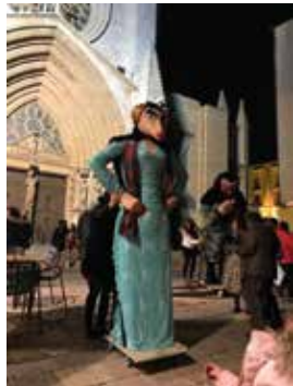
La Farra dels Ninots

Hi col·laboren: Amics de la Part Alta i Cervesa Damm