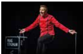
Més que màgia

Ho organitza: Cooperativa Obrera Tarraconense (COT)