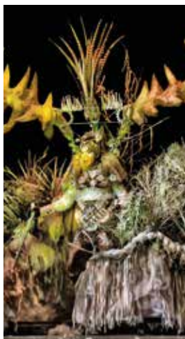
20a Disfressa d'Or

20 h. TAP (Tarraco Arena Plaça), c. Mallorca, 18. La Disfressa d'Or. La Disfressa d'Or aposta per la proximitat i canvia de dia. En l'acte en què les comparses participants llueixen les seves millors gales hi trobarem un desplegament únic per a un dels actes que ha agafat més cos al Carnaval de Tarragona. Una única desfilada per poder veure i gaudir les millors disfresses individuals.