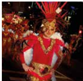
Rua de l'Artesania.

22 h. The Bar, c. Rebolledo, 9. Old Fashioned Carnival. L'estil dels anys 30 i la llei seca prenen el Carnaval a The Bar. La disbauxa impera perquè tot s'hi val. Voldràs ballar el cancan amb nosaltres? Entrada lliure, limitada a l'aforament de la sala.