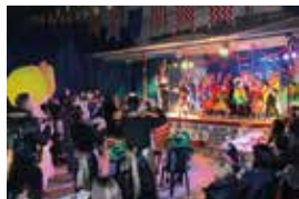
Concurs i festa de disfresses del Carnaval al barri del Port