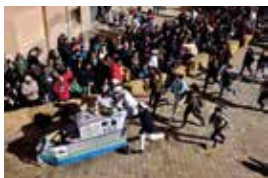
Baixada del Pajaritu.

11.30 h. Centre Cívic de Sant Pere i Sant Pau, camí del Pont del Diable, s/n. Esmorzar popular amb coca i xocolata.