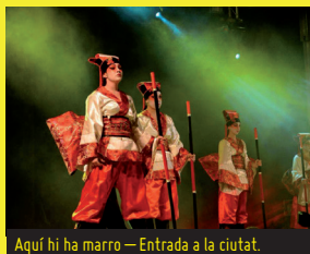
Aquí hi ha marro — Entrada a la ciutat.

18.30 h. Des del Teatre Metropol. Entrada a la ciutat del Carnestoltes XXXIII, la Concubina XX, els Sèquits i els concubinat respectius , seguits dels penons i estendards que els vulguin acompanyar. Itinerari: Rambla Nova (tram Teresianes), estàtua dels Despullats i Rambla Nova fins al balcó. Organitzen: Comparses Aquí hi ha marro i La Ballaruga