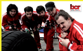
La Banda del Coche Rojo

Organitza: Abril Producciones – Music From Tamarit