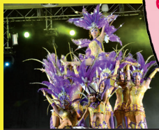
Colours Fantasy — Disfressa d'Or

20 h. Recinte firal, al costat de Renfe. Segona desfilada de la Disfressa d'Or. Obertura de portes a les 19.30 h.