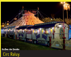
El Circ Raluy.

18 h. Parc Francolí. Circ Raluy presenta Boom! . La nova proposta del Circ Raluy connecta la tradició i la modernitat. En aquest espectacle, el Circ Raluy aposta per convidar artistes de reconegut prestigi internacional a formar part de la família, per tal de mantenir així l'esperit tradicional del circ i, al mateix temps, reinventar-lo i posar-lo al dia. Podreu visitar també la seva magnífica col·lecció de carruatges de circ, unes preciositats que val la pena admirar! Venda d'entrades a les taquilles del circ d'11 a 13 i a partir de les 15 h. També online a www.raluy.com — 609 321 207 Preus: Nens de 8 a 25 € i adults de 15 a 30 €. El dijous, dia de l'espectador, preu únic: 6 € tribuna i 10 € platea.