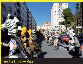
Av La Unió — Rua.

Participen: AV La Unió i altres entitats del barri