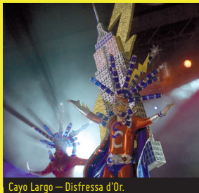
Cayo Largo — Disfressa d'Or.

18 h. Recinte firal, al costat de Renfe. La Disfressa d'Or , passarel·la amb