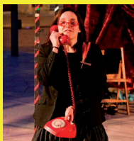
Rua Capicua — Teatre familiar.