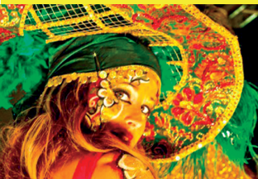
Aerodance — Rua de Lluïment

19 h. Des de la Rambla Nova (Font del Centenari) fins a Sant Agustí i la Rambla Vella. La Rua de Lluïment . La rua de les comparses més espectaculars, així com els Sèquits del Carnestoltes i de la Concubina.