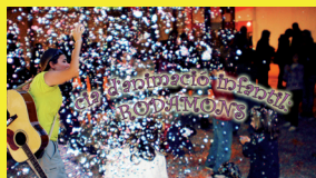
Cia. Rodamons — Ball infantil.

Patrocinen: Catering Service, Makro i Chocolates Valor