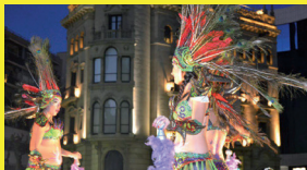
Fotem-li canya — Rua de l'Artesania

l'arribada de la primera comparsa: Av. Ramón y Cajal, Rambla Nova (18.45 h) fins a l'alçada del c. Sant Agustí (19.30 h), pl. Verdaguier i Rambla Vella fins al c. Sant Francesc (20 h).