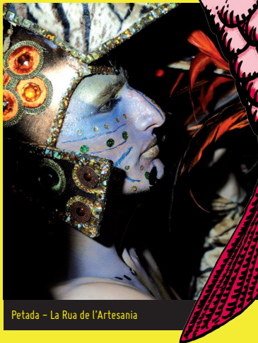
Petada - La Rua de l'Artesania

18 h. Des de l'avinguda Ramón y Cajal cap a la Rambla Vella. La Rua de l'Artesania , amb comparses, comparsers, carrosses, senyeres, penons i els Sèquits del Rei i de la Concubina.