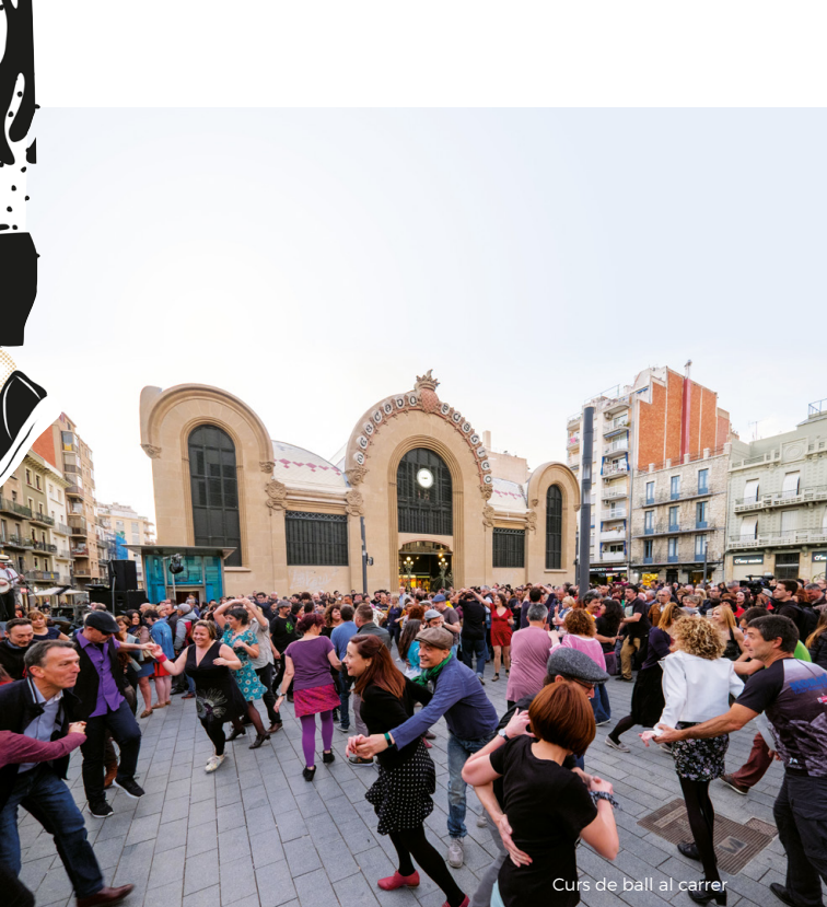
Curs de ball al carrer