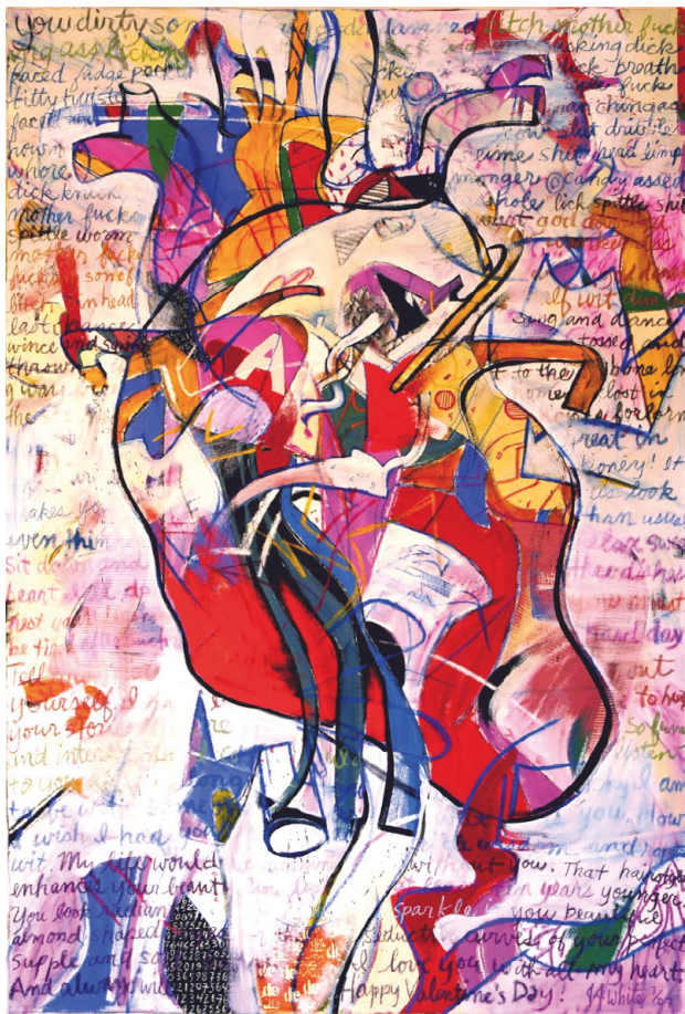
Obra de J. James White