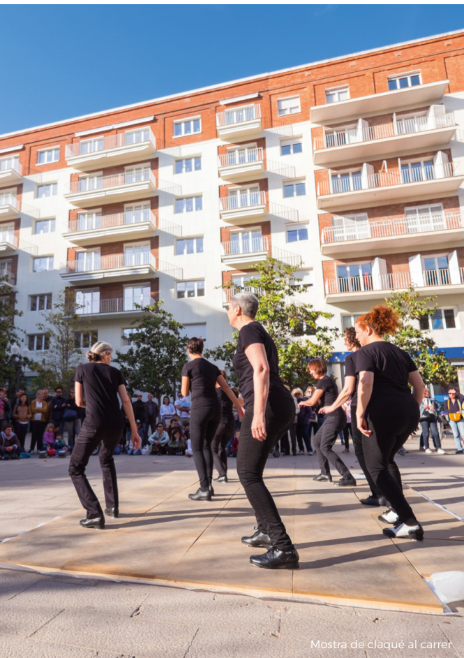
Mostra de claqué al carrer