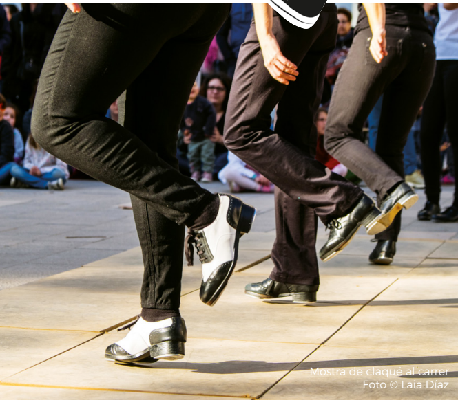
Mostra de claqué al carrer