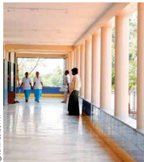
Nuevo pabellón del Departamento de Enfermedades Infecciosas.

► Una de las principales causas de muerte por tuberculosis es la combinación con otra enfermedad que afecta al sistema inmunológico, el VIH. Para prevenirlo, la Fundación Vicente Ferrer inauguró el pasado marzo dos nuevos pabellones en Bathalapalli donde trata exclusivamente a las personas afectadas por tuberculosis pulmonar y multirresistente. Las nuevas instalaciones, ubicadas dentro del Departamento de Enfermedades Infecciosas, cuentan con amplios ventanales y techos altos que permiten mejorar la ventilación y reducir el riesgo de contagio. Dos meses más tarde se inauguró en el mismo centro un laboratorio de microbiología capaz de detectar casos de tuberculosis multirresistente en tan sólo dos horas, lo que reduce mucho el tiempo de espera de pacientes. La nueva instalación permite así mejorar el trato a pacientes que vienen de lejos y no pueden esperar varios días en el hospital a saber los resultados.