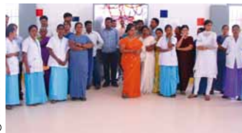
Personal sanitario del Hospital de Bathalapalli.