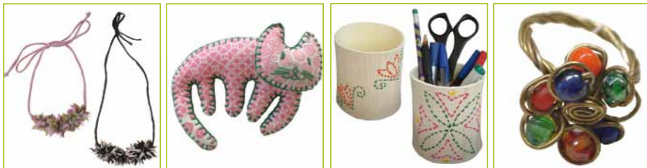
Collar de flores de tela

Durante estos diez años, 251 mujeres han pasado por los talleres que la FVF tiene en Andhra Pradesh. Actualmente trabajan 145 artesanas. Los beneficios obtenidos de la venta de estos productos se reinvierten en la India. Así, la Fundación puede seguir trabajando en el desarrollo de las comunidades más desfavorecidas. Todos estos productos están disponibles en las tiendas que la FVF tiene en Barcelona, Palma y Ciutadella y también a través de la tienda online.