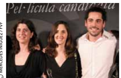
Parte del equipo del documental.