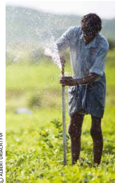
Riego por aspersión.

► El Ayuntamiento de Tarragona ha decidido mantener su apoyo al trabajo que la Fundación Vicente Ferrer realiza en la India. Por ello, ha renovado su compromiso con el programa de desarrollo integral al financiar un proyecto de ecología por segundo año consecutivo. En concreto, este año ha colaborado con el riego por aspersión en el área de Mudigubba. El objetivo es mejorar y optimizar el uso de los recursos hídricos para garantizar el sustento de 219 familias de la zona.