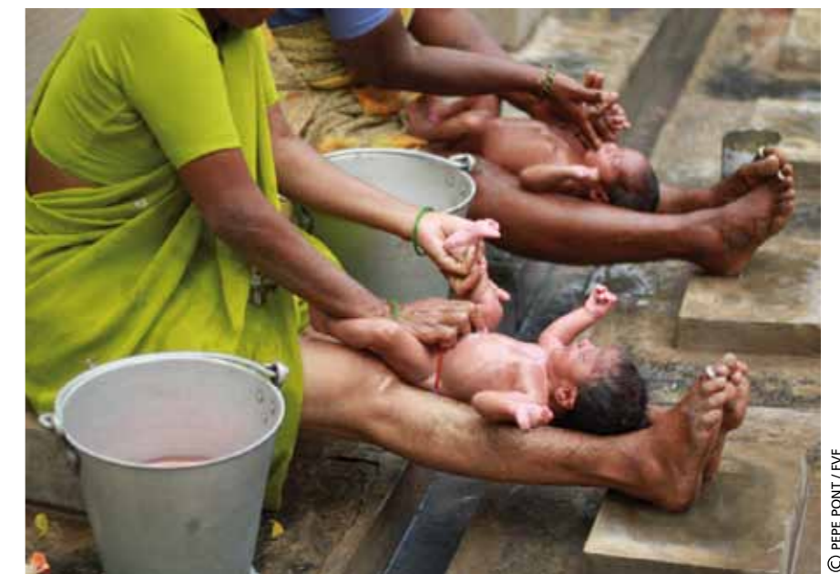
Baño tradicional de los bebés.

► Tras 20 años de intervenciones quirúrgicas para controlar la natalidad en Anantapur, el centro de Planificación Familiar ha sustituido la cirugía abierta por la laparoscopia. Se trata de una nueva técnica, menos invasiva, que supone menos tiempo de recuperación y ya no hace preciso el ingreso de las pacientes. Con este cambio, ya no se verá la tradicional escena de las abuelas bañando a sus nietos y nietas mientras las madres descansan convalecientes en las habitaciones del centro. Gracias a estos avances, el pasado abril se iniciaron las obras para renovar el centro de Planificación Familiar de la Fundación y convertir las habitaciones libres en una academia de formación profesional para jóvenes. La Fundación mantendrá el quirófano y una sala para las intervenciones.