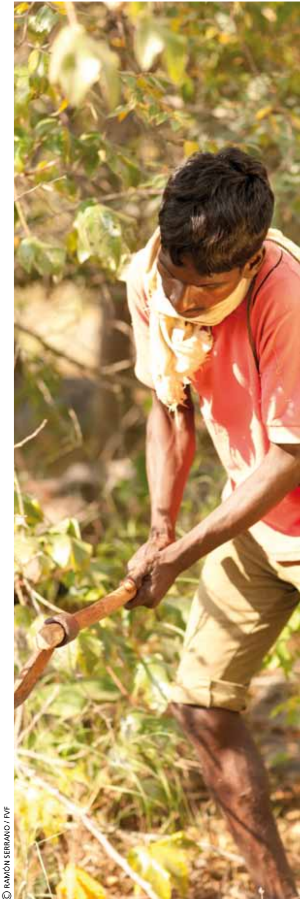
Hombre de la tribu chenchu cortando leña.