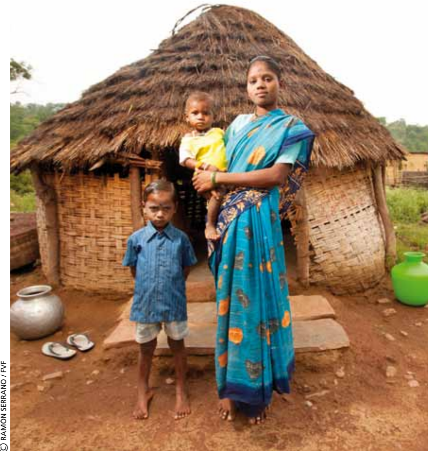
Familia de la tribu chenchu.

Las tribus chenchu llevan ya 25 años trabajando con agencias gubernamentales como la Agencia Tribal para el Desarrollo Integral (ITDA), pero los avances conseguidos son escasos, "probablemente a causa de la falta de una organización comuni-