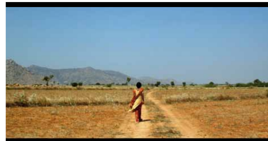
Frame de Espera un Milagro .