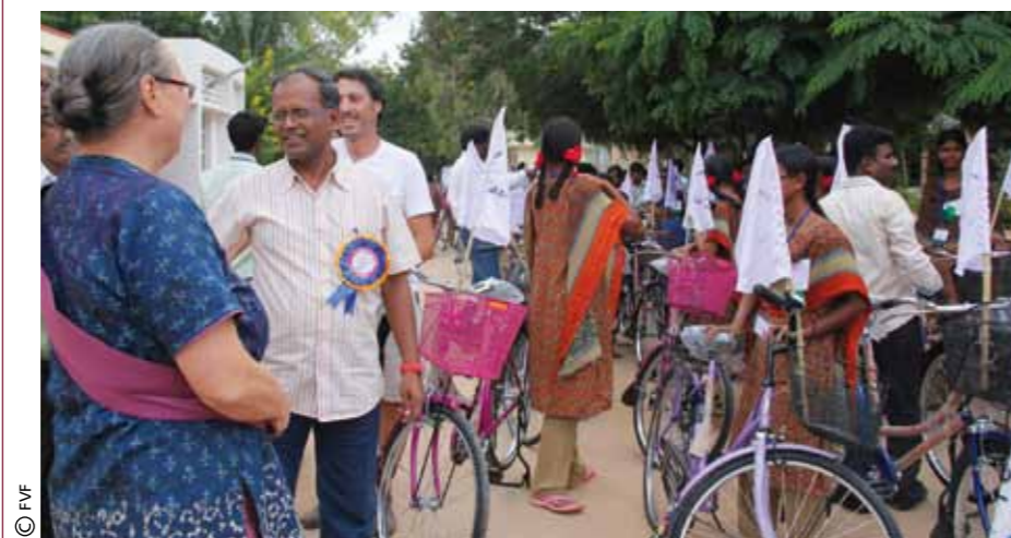
Jornada en Menorca.