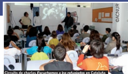
Círculo de charlas Escuchemos a los refugiados en Cataluña

Es una actividad que está funcionando muy bien y a la que queremos dar un nuevo impulso a partir del próximo año con la inclusión de información sobre los refugiados y desplazados españoles y catalanes durante la Guerra Civil.