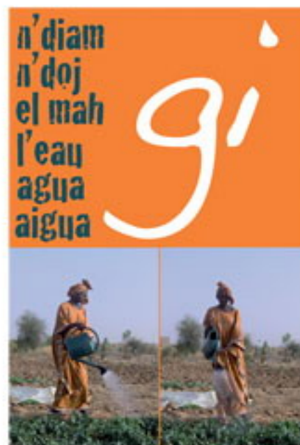
Cartel de l'exposició sobre l'aigua a Mauritània, organitzada per Santa Perpètua Solidària (SPS).