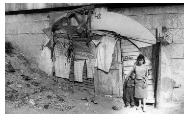
Riu Francolí, 1964.

La possibilitat de treballar en una àrea econòmicament beneficiada pel turisme i la indústria serà l'esquer d'un fort i constant corrent immigratori que comportà que en quatre anys, entre 1960 i 1964, la ciutat registrés un augment del 20%, passant de 43.519 a 52.056 habitants. És a dir, una cinquena part de la població era nousvinguda.