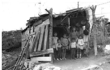
Riu Francolí, 1964.