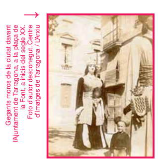
Gegants moros de la ciutat davant Ajuntament de Tarragona a la plaça de la Font, a inicis del segle XX.