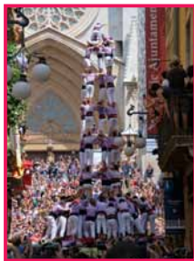
Autora: M. Neus Baena

12h, plaça de les Cols. Castells, torres i pilars , amb els Xiquets de Tarragona, Jove Xiquets de Tarragona, Xiquets del Serrallo i Castellers de Sant Pere i Sant Pau. Cada colla intervé per torn rotatiu, decidit per sorteig. L'actuació consta de tres rondes, però la colla que no completi les tres construccions pot arribar a fer dues tandes més, mantenint l'ordre sortejat, i en la darrera ha d'aixecar construccions superiors a les ja bastides. Els pilars tanquen l'exhibició. En finalitzar, toc de vermut amb els grallers i els timbalers de les colles.